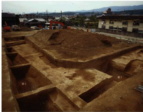
室町時代から江戸時代の調査区 (北東から)

http://www.kyoto-arc.or.jp (財)京都市埋蔵文化財研究所・京都市考古資料館