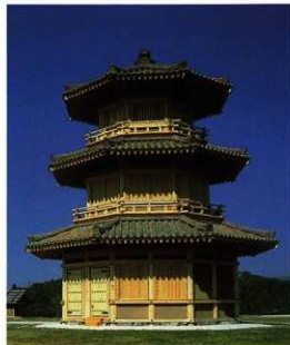
■復元建物（八角形鼓樓）

3間（5.85m）×7間（16.8m）の建物跡。役所のような施設で、城を管理する建物であったと考えられます。