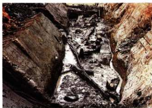
■貯水池跡貯木場 貯木場からは、建物の建設に使う木材や、斧の柄や鋤などの木製農具が出土しました。