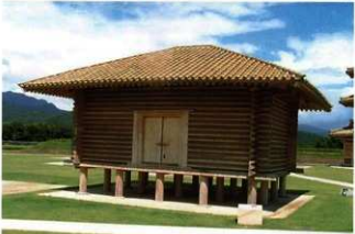
■上：20号建物跡、下：20号建物跡を復元した米倉 鞠智城Ⅳ期の建物で、3間（7.2m）×4間（9.6m）の礎石建物です。この時期には、同規格の建物が規則正しく配置されています。