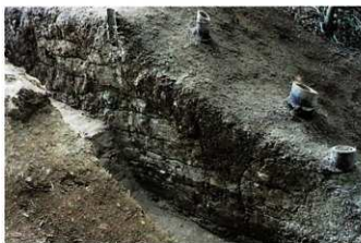
■版築土塁 土を何度も突き固めることで強固な壁をつくる「版築」という大陸伝来の土木技術を使ってつくられた土塁です。