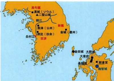
7世紀の日本と朝鮮半島

しかし、結果として唐と新羅による日本侵攻はありませんでした。鞠智城はその後、役所的な役割を持つ施設などに変化し、10世紀半ばまで存続しました。