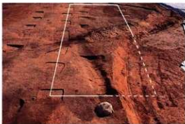
■大型掘立柱建物跡 （63号建物跡）

出土遺物を見ると、土器などの日用品はこの時期のものが最も多く出土しています。そのため、城の管理・運営に多くの人員が配置された時期であったと考えられます。