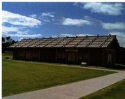
■復元建物（左：兵舎、右：板倉）

鞠智城の創建期です。白村江の敗戦により、唐と新羅の侵攻に備え、築城されます。掘立柱建物の倉庫や兵舎が建てられ、3箇所 （1） の城門、土塁線、貯水池など、城としての最低限の機能が緊急的に整備されました。また、百済系の銅造菩薩立像の存在から、築城にあたっては百済の高官が関与したと考えられます。