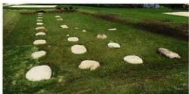
■大型礎石建物跡（49号建物跡；宮野礎石群） 鞠智城Ⅲ期に出現する礎石建物です。3間（7.2m）×9間（21.6m）の建物で、長倉と呼ばれる倉庫であったと考えられます。

しかし、この時期の土器などの日用品はほとんど見あたりません。このことから、施設を存続していくための必要最低限の人員のみを配置するなど、城の管理・運営になんらかの変化が生じた時期と考えられます。