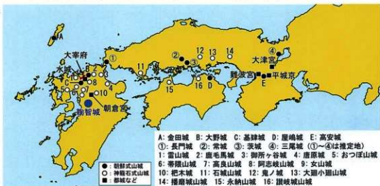
A: 金田城 B: 大野城 C: 基肄城 D: 鹿嶋城 E: 高安城 ①: 長門城 ②: 常城 ③: 茨城 ④: 三尾城 (①~④は推定地) 1: 雷山城 2: 鹿毛馬城 3: 御所ヶ谷城 4: 唐原城 5: おつぼ山城 6: 帯隠山城 7: 高良山城 8: 阿志岐山城 9: 女山城 10: 杷木城 11: 石城山城 12: 鬼ノ城 13: 大廻小廻山城 14: 播磨城山城 15: 永納山城 16: 讃岐城山城