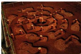
■八角形建物跡 (32号建物跡) 中心に直径90cmの心柱を据え、その周囲に八角形に配置された柱が三重に巡っています。