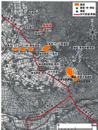
古代官道（推定）と鞠智城周辺の古代遺跡

鞠智城内の灰塚からは、360度の眺望を楽しめます。特に南方に目を向けると、菊鹿盆地を一望することができ、遠くは長崎県の雲仙普賢岳（矢印）まで見通すことが出来ます。