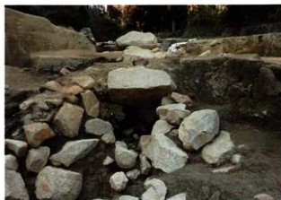
■池ノ尾門跡 (水門) 鞠智城跡で唯一、石積みと水門が見つかりました。幅9.6mの石塁を谷部を塞ぐようにして構築し、防御施設としていました。