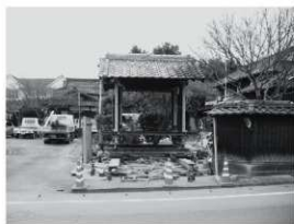
⑧東門 曳移転 (東から)