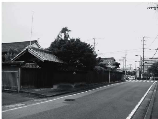
①東門・東側外観（改修前、南東から）