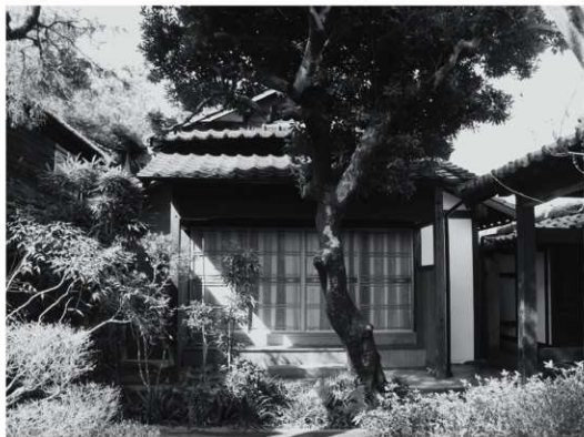
②座敷外観（改修後、東から）