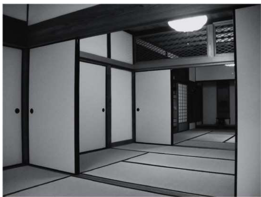
②次の間（改修後、北東から）