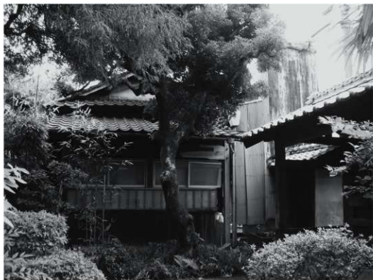
①座敷外観（改修前、東から）