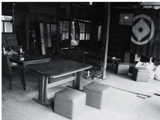
①次の間（改修前、北東から）