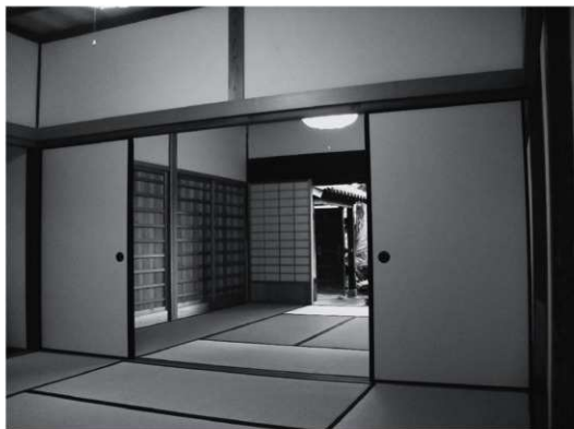
②玄関の間（改修後、南西から）