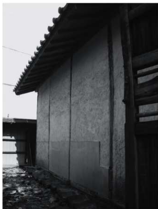
① 数寄屋北壁外観（改修前、北西から）