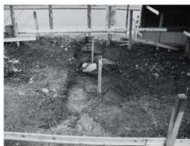
②東門 移設箇所石敷 (西から)