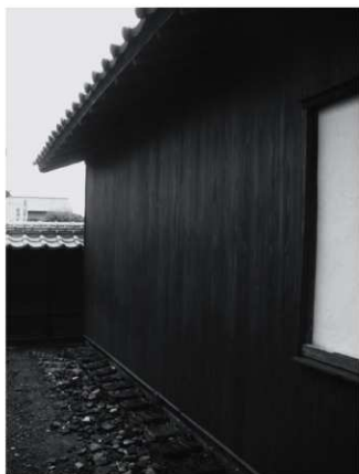
② 数寄屋北壁外観（改修後、北西から）