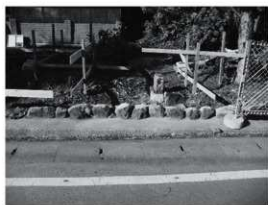
④東門 旧基礎石敷 (東から)