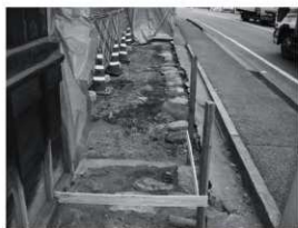
⑥北崩 基礎部分石敷 (東から)