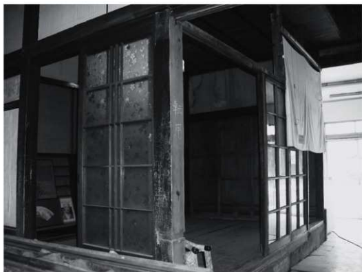
①奥座敷（改修前、南東から）