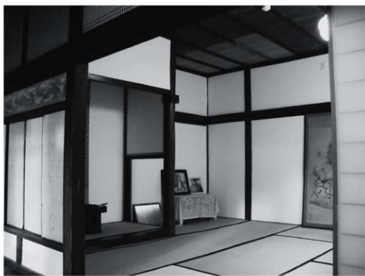
②奥座敷（改修後、南東から）