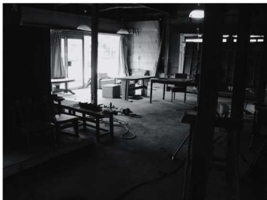
①玄関の間（改修前、南西から）