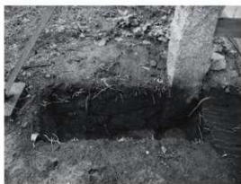
⑦北崩 控柱トレンチ (東から)