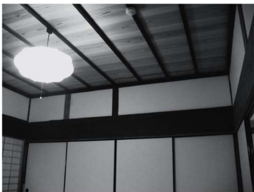
② 玄関の間壁面・天井（改修後、北西から）