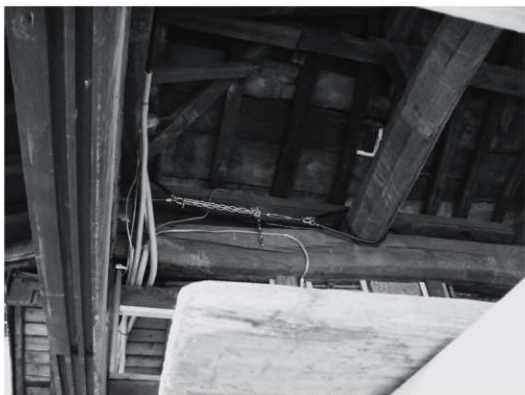
① 玄関の間補強工事（北から）