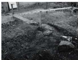
①東門 移設箇所石敷 (南東から)