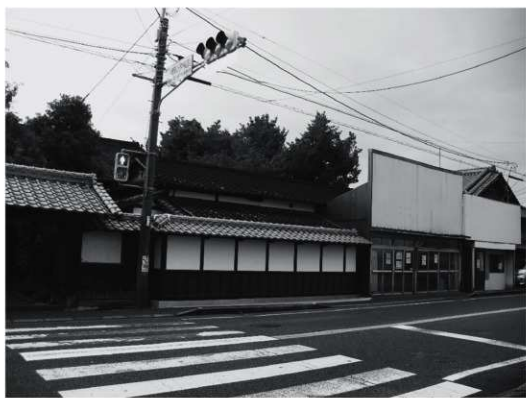
②座敷・北塀外観（改修後、北東から）