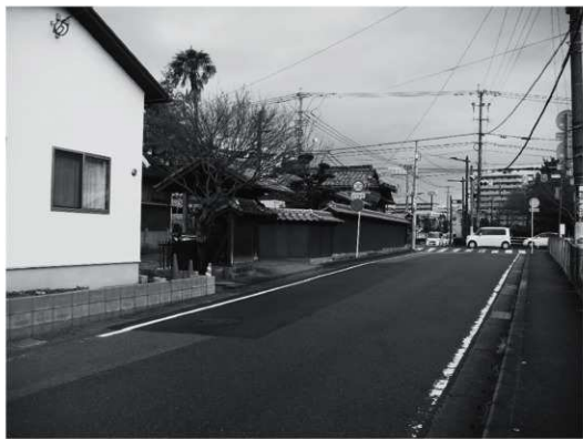
②東門・東側外観（改修後、南東から）