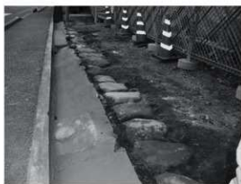
⑤北崩 基礎部分石敷 (北西から)