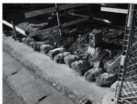
③東門 旧基礎石敷 (北東から)