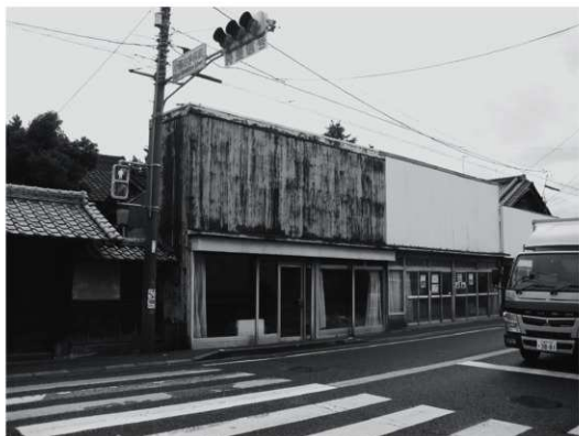
①座敷外観（改修前、北東から）