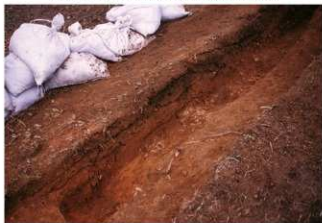
⑤ 8号トレンチ土層断面中央部（北東側から）