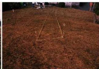
⑦ 3号トレンチ掘削前全景 (東側から)