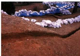
① 1号トレンチ土層断面後凹部から前方部（南東側から）