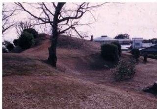
⑤墳丘西側前方部から後円部を臨む（北西側から）