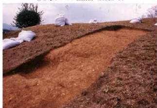
④ 2号トレンチ土層断面墳頂側 (南東側から)