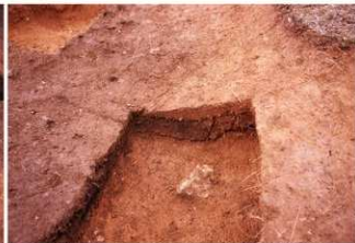
⑦盗掘坑サブトレンチ3東西土層断面（南側から）