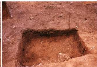
⑥盗掘坑サブトレンチ3南北土層断面（東側から）