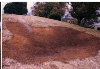
② 盗掘坑表土剥ぎ後全景 (南西側から)