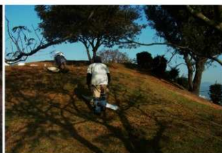
⑦7号トレンチ作業風景（南東側から）