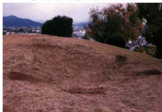
③ 盗掘坑掘削前全景 (南西側から)