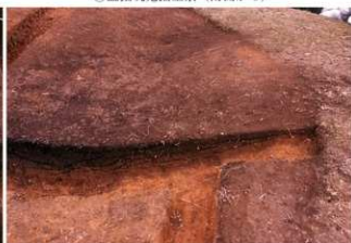
⑥ 盗掘坑南北土層断面南側 (西側から)