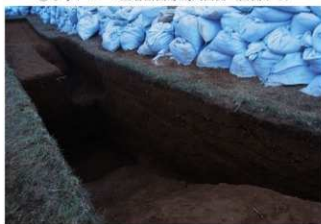
⑦ 3号トレンチ土層断面貯蔵穴東側 (南東側から)