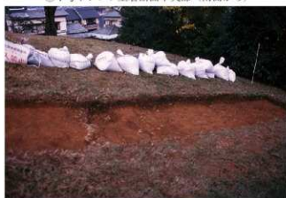
⑥7号トレンチ土層断面墳裾部（南側から）