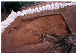
① 9号トレンチ完掘全景（南側から）