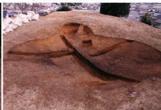
④ 盗掘坑完掘全景 (南側から)