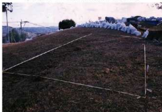
⑦ 9号トレンチ掘削前全景（西側から）