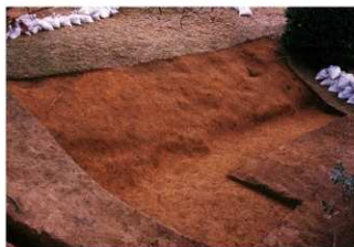
① 10号トレンチ完掘全景 (北西側から)