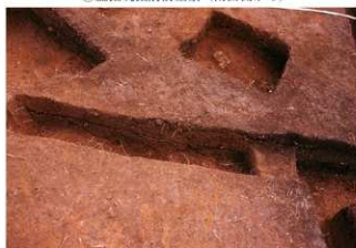
⑤ 盗掘坑南北土層断面北側 (西側から)