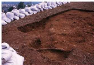
② 9号トレンチ完掘全景（西側から）