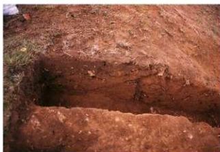
④ 5号トレンチ土層断面墳頂側（北側から）