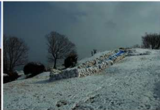
④積雪時墳丘西側後円部から前方部を臨む（南西側から）