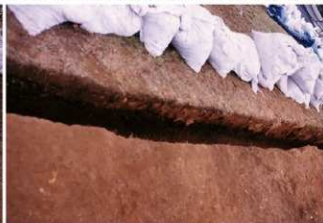
④ 1号トレンチ土層断面前方部図版3-③と図版3-⑤の間（南東側から）