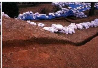
② 1号トレンチ土層断面前方部の内後凹部側（南東側から）