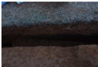
⑤ 3号トレンチ土層断面後部傾斜付近 (南側から)