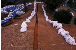
③1号トレンチ完掘全景（南側から）