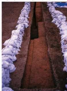
⑨ 3号トレンチ完掘全景 (西側から)