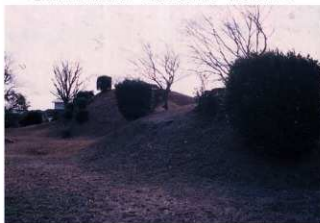
⑦墳丘東側前方部から後円部を臨む（北東側から）