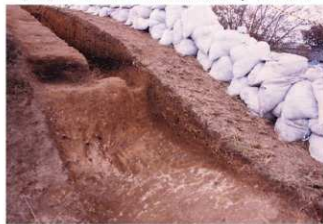
⑦ 1号トレンチ土層断面前方部墳裾（北東側から）