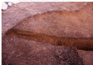
⑦ 盗掘坑東西土層断面西側 (南側から)