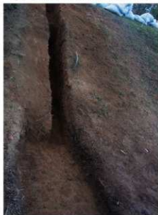
③ 5号トレンチ完掘墳裾部（西側から）