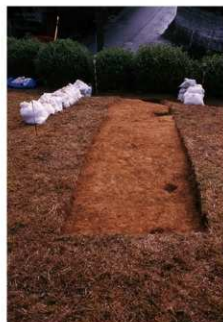
② 2号トレンチ完掘全景 (北側から)