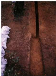
② 5号トレンチ完掘全景（西側から）