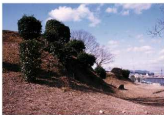
①墳丘東側後円部から前方部を臨む（南東側から）