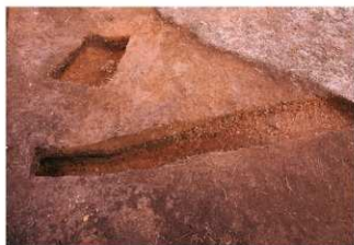
①盗掘坑東西土層断面東側（南側から）