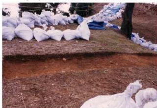
⑤4号トレンチ土層断面墳頂側（北側から）