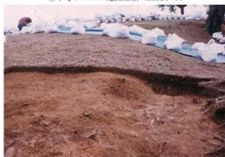
③ 9号トレンチ東壁土層断面（西側から）