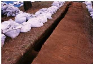
③ 1号トレンチ土層断面前方部土坑に切られている付近（南東側から）