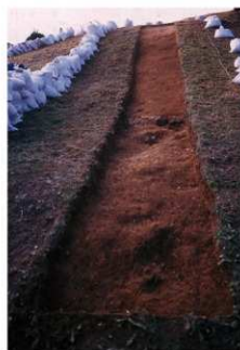
②7号トレンチ完掘全景（西側から）