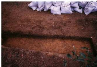
⑥ 5号トレンチ土層断面墳裾側（北側から）