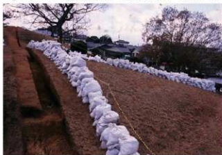
⑥1号トレンチ完掘墳裾部全景（北側から）