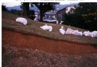
⑤7号トレンチ土層断面中央部（南側から）