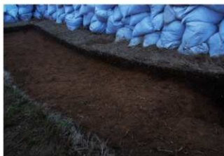
①3号トレンチ土層断面西端（南東側から）