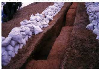
⑥ 3号トレンチ土層断面貯蔵穴西側 (西側から)