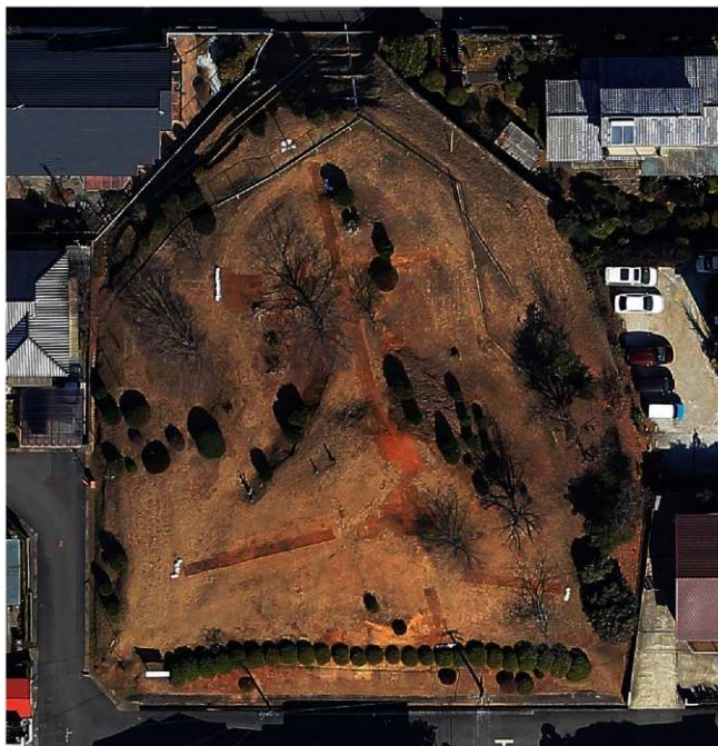
①津古1号墳全景（真上から）