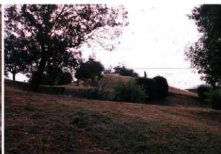
⑤ 墳丘西側前方部から後門部を臨む（北西側から）