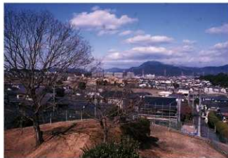
②墳頂より地峡帯を臨む（南側から）