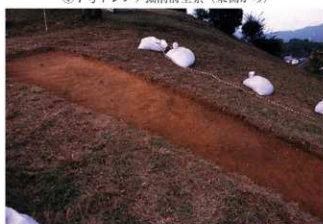
④7号トレンチ土層断面墳頂部（南側から）