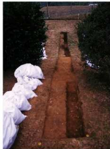
③ 8号トレンチサブトレンチ設置前全景（西側から）