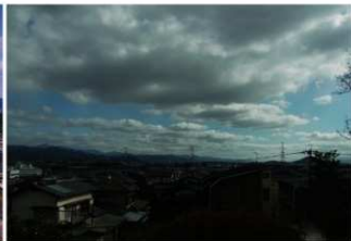
③墳頂から花立山を臨む（西側から）