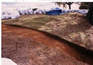
⑥4号トレンチ土層断面中央部（北側から）