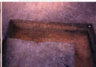
⑧ 盗掘坑東西土層断面中央 (南側から)