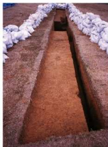
⑧ 3号トレンチ完掘全景 (東側から)