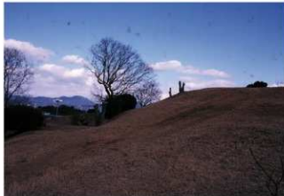
③墳丘西側後円部から前方部を臨む（南西側から）