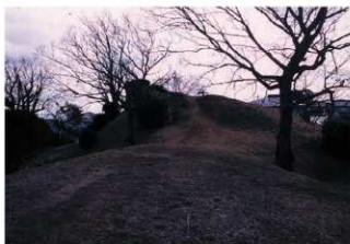
①1号トレンチ掘削前前方部から後円部を臨む（北側から）