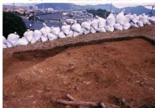
④ 9号トレンチ北壁土層断面（南側から）