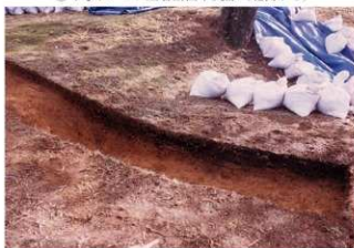
⑦4号トレンチ土層断面墳裾側（北側から）