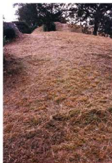
②1号トレンチ掘削前全景（北側から）