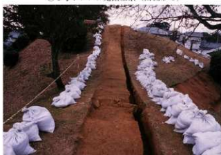
⑤1号トレンチ完掘前方部から後円部を臨む（北側から）