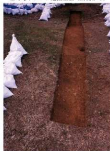
④4号トレンチ完掘全景（北東側から）