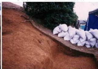
⑧ 10号トレンチ南壁土層断面（北側から）