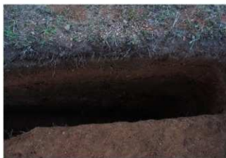
④ 3号トレンチ土層断面東端 (南側から)