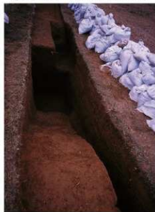
⑩ 3号トレンチ貯蔵穴全景 (東側から)