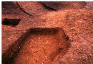
④盗掘坑サブトレンチ2東西土層断面（北側から）