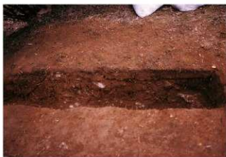
④ 8号トレンチ土層断面墳頂側（北側から）