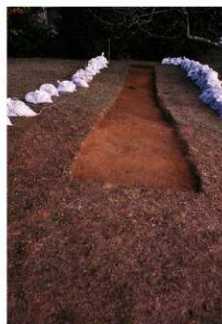
③7号トレンチ完掘（西側から）