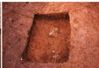
⑤盗掘坑サブトレンチ3完掘全景（南側から）