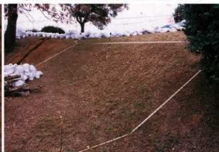
⑥ 10号トレンチ掘削前全景（南側から）