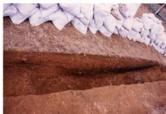
⑥ 1号トレンチ土層断面前方部頂部北端 up（東側から）