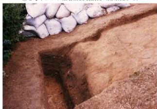
⑤ 2号トレンチ土層断面墳裾側 (東側から)