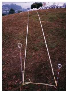
②4号トレンチ掘削前全景（西側から）