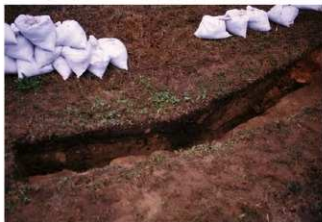
⑥ 8号トレンチ土層断面墳裾側（北側から）