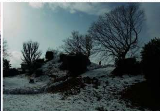
⑧積雪時墳丘東側前方部から後円部を臨む（北東側から）