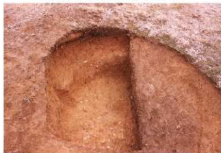
②盗掘坑サブトレンチ2完掘全景（南側から）