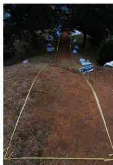
④1号トレンチ掘削前全景（南側から）