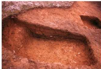
③盗掘坑サブトレンチ2南北土層断面（西側から）