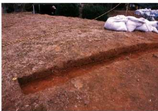
⑦1号トレンチ土層断面後円部頂部（東側から）