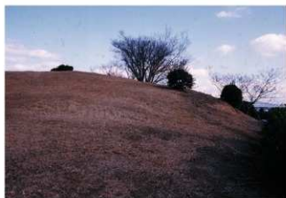
① 2号トレンチ掘削前 (西側から)