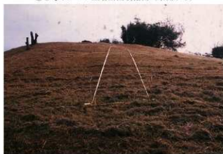
⑥ 3号トレンチ掘削前全景 (西側から)