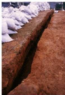
⑤ 1号トレンチ土層断面前方部頂部北端（南側から）