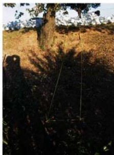
① 5号トレンチ掘削前全景（西側から）