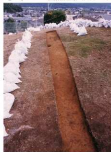
③4号トレンチ完掘全景（西側から）