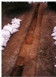
① 8号トレンチサブトレンチ完掘全景（東側から）