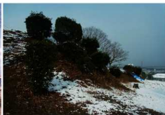
②積雪時墳丘東側後円部から前方部を臨む（南東側から）