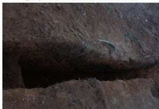
⑤ 5号トレンチ土層断面中央部（北側から）