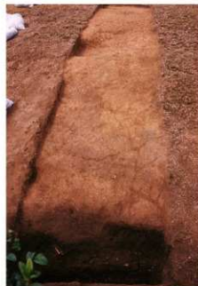
③ 2号トレンチ完掘全景 (南側から)