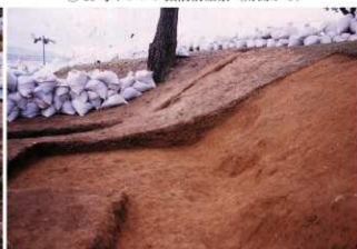
⑦ 10号トレンチ北壁土層断面（南側から）