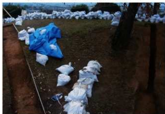
⑦ 4号・5号トレンチ全景（西側から）