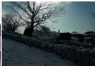
⑥積雪時墳丘西側前方部から後円部を臨む（北西側から）