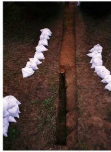
② 8号トレンチサブトレンチ設置前全景（東側から）