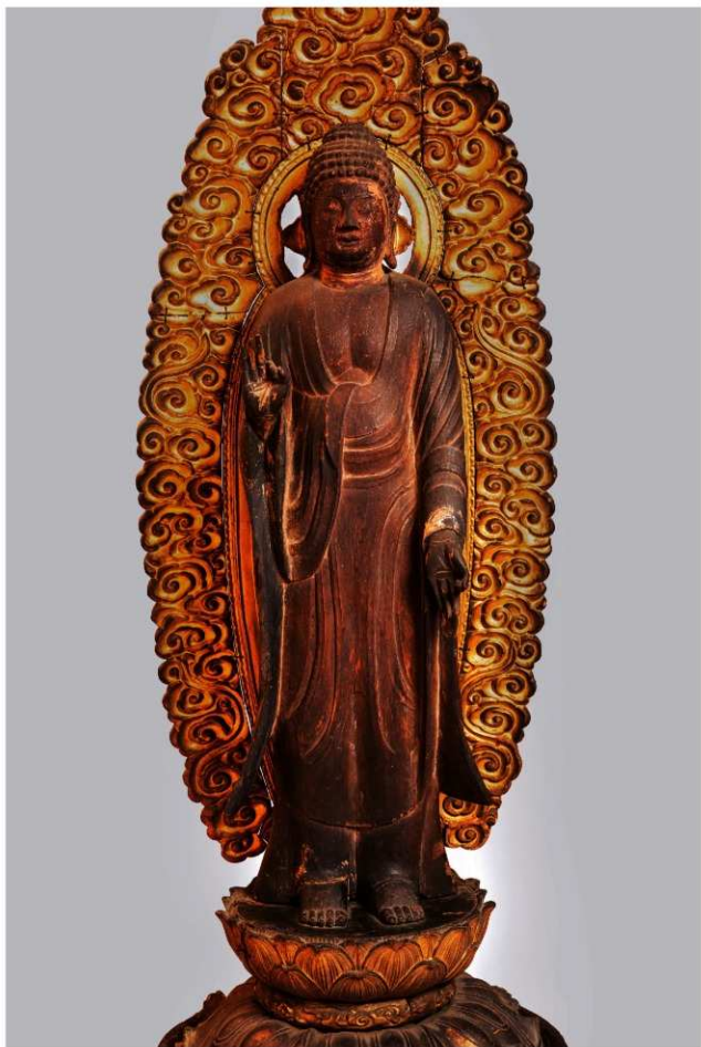
【写真 1】 来迎寺木造阿弥陀如来立像