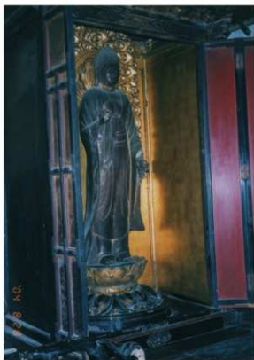
【写真 4】 大保・西福寺での安置状況 (1)