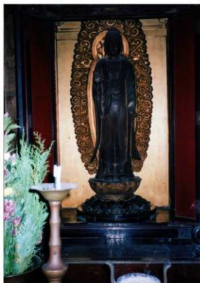
【写真 5】 大保・西福寺での安置状況 (2)