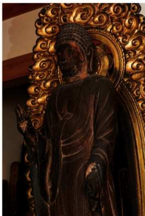
【写真 2】 来迎寺木造阿弥陀如来立像（上半身）