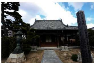
【写真7】 丹南・来迎寺本堂（南から）