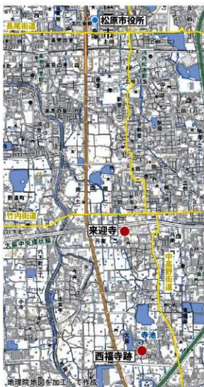
【図1】 来迎寺及び西福寺跡位置図