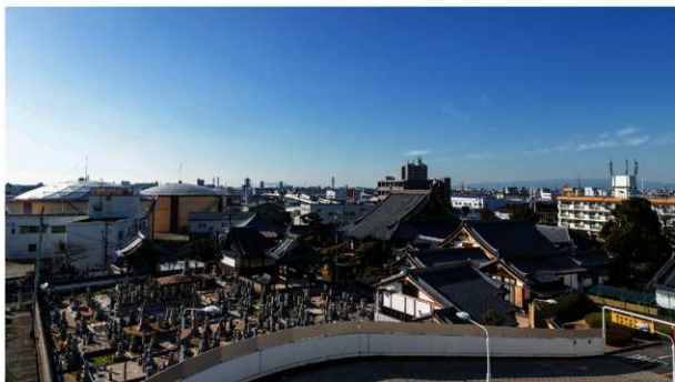
【写真6】 丹南・来迎寺外觀（東から）