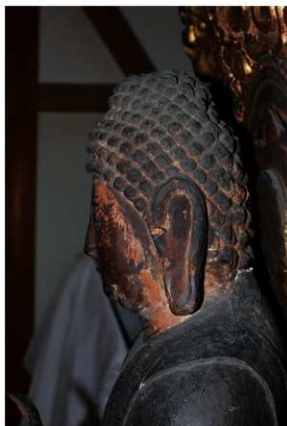
【写真 3】 来迎寺木造阿弥陀如来立像（頭部左側面）