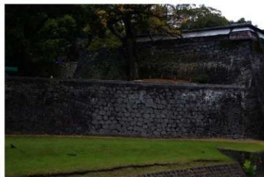
江戸時代の面影を残す長堀下石垣東端（南から）

石垣の修復履歴調査では、その大部分は下端付近まで金峰山地震後に積み直されていたが、東の平御橋台から 15m 付近までの区間はそのまま、西側の一部は天端石から 2～3 石下まで、江戸時代の石垣が残ることが判明しました。