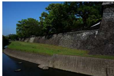
平成 28 年熊本地震で倒壊した長堀（南東から）

その後、台風、水害などの自然災害による倒壊、破損のたびに文化財としての修復を重ね、平成 28 年（2016）4 月の「平成 28 年熊本地震」での被災による全解体を経て、今日に至ります。