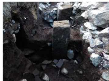
発掘された江戸時代の控石柱。上部は失われています。