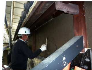
作業のほとんどが職人の手仕事