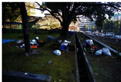
発掘調査の様子。手作業で慎重に掘り下げていきます。

堀本体を支える控石柱は、頭部がカマボコ形あるいは四角錐形で凝灰岩製のものは一部を除き昭和 2 年（1927）以前のもと考えられます。また、現在見られるものとは異なる位置から江戸時代の控石柱が出土しました。これらの成果は、長堀の変遷を考える上で重要な発見となります。