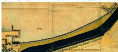
絵図⑥「御土居絵図（長堀部分）」 文政元～10 年（1818～27）。江戸時代を通じて、長大な長堀の姿は保たれている。