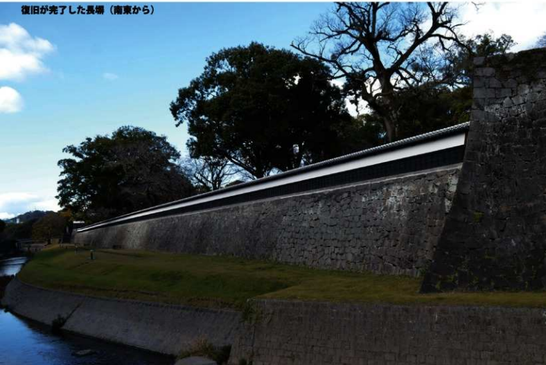
復旧が完了した長塀 (南東から)