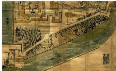
絵図⑤「御城内御絵図（長堀部分）」（熊本市蔵） 明和 6 年（1769）頃。石垣の上に途切れることなく堀が描かれている。