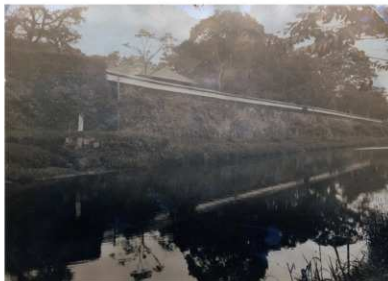
昭和3年頃の長塀(南西から、熊本市蔵)