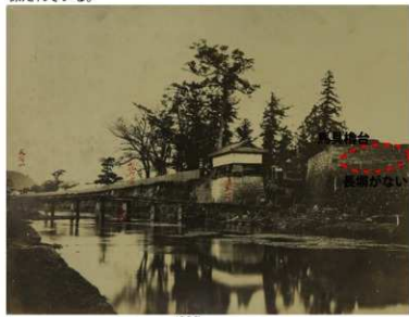
古写真① 坪井川左岸から見た下馬橋（東から撮影） 明治 10 年（1877）頃。長堀が馬具橋台手前に見られず、解体されている。