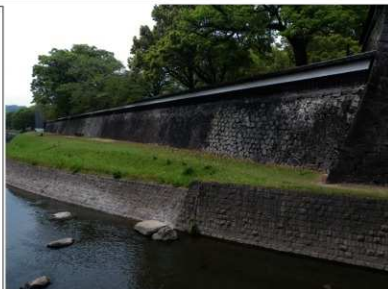
平成28年熊本地震被災前の国指定重要文化財長塀(南東から)

長塀は昭和3年(1928)に国宝に指定され、昭和25年(1950)の文化財保護法制定後、改めて国の重要文化財になりました。