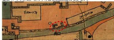
絵図②「熊本屋敷跡下絵図（長堀部分に加筆）」（熊本県立図書館蔵） 寛永 6～8 年（1629～31）。石垣中央には今はない虎口（出入口）がある。