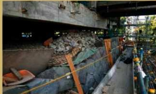
大天守台石垣の石積み状況