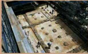
飯田丸五階櫓破石等も回収