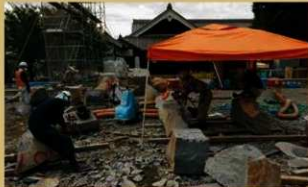
交換石材作成の様子