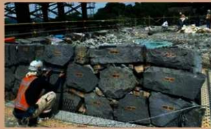
石垣解体前の基準線書き