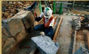
交換石材作成作業（石材細部の加工）