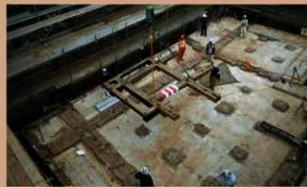
五階櫓最後の部材撤出