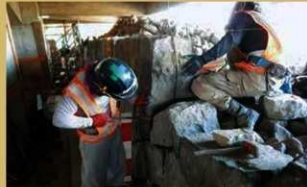
大天守台石垣穴蔵石積み作業