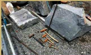
石材を加工する道具の一部