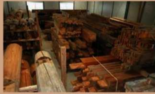
五階櫓本体は部材ごとに選別して保管