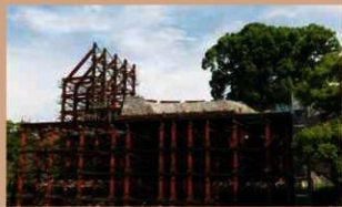
H30.9.11 飯田丸五階櫓台全景

天守台石垣の復旧工事では、大天守台の石垣積み直し作業に取り掛かりました。 また、積み直しに伴って解体した石材の補修や新しく交換する石材の作成も行っています。