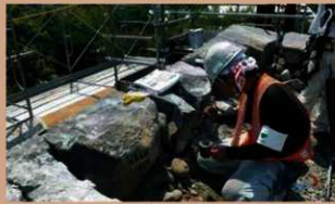
解体石材の番号付け