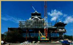
H30.9.5 天守閣工事 東より