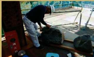
破損石材補修作業（破片の接合）