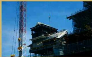
H30.8.29 天守閣工事 西より