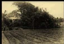
吉田古墳遺景(大正14(1925)年)

今日でも、台湾里官衙遺跡群に触れた多くの研究論文には、高井の報告書が引用・参照されており、その調査成果に言及されています。それだけ、高井の発掘調査は、以後の台湾里官衙遺跡群の調査・研究に大きな影響を与えているのです。