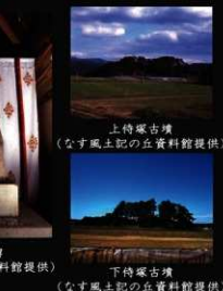
上侍塚古墳 (なす風土記の丘資料館提供)

若林勝郎による発見以降、大貝塚跡は『常陸国風土記』に記された貝塚として、多くの研究者の調査対象となっていきました。昭和11(1936)年に行われた大場磐雄らによる学術調査をはじめとして、昭和時代には相次いで発掘調査が実施されました。そして昭和45(1970)年には、これら調査成果の蓄積が実を結び、文献に残る我が国最古の貝塚として、国指定史跡となったのです。