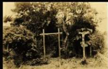
吉田古墳遺景(大正14(1925)年)