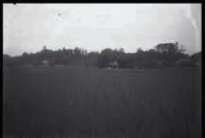
大貝塚遺跡景(昭和11(1936)年)