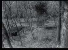
台湾里麿寺跡調査現場写真 (昭和16(1941)年頃)