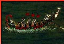
19世紀 琉球 はりゅう船の船幟

また、船幟としては、薩摩藩に服属していた琉球王国が中国への進貢船に「日の丸」を用いていた。いつから日の丸を掲げるようになったのかは定かではないが、19世紀初頭の進貢船屏風絵には、はっきりと「日の丸」が描かれている。また沖縄の祭り爬竜（ハーリー）で用いられる爬竜船の船尾部にも「日の丸」の幟（のぼり）が掲げられている。