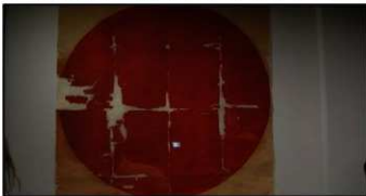
伊達家の旗のひとつ「日の丸大龍」

また、室町時代の勘合貿易や、寛永12年（1635）までの間に行われた朱印船貿易の際に日本の船籍を表すものとして船の船尾に「日の丸」が掲げられている。戦国時代には日の丸の旗幟等がさかんに使われており、毛利氏・上杉氏・伊達氏などが軍旗として、日の丸を用いている。