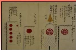
江戸幕府将軍御召船 船幟（日の丸）

将軍の御座船安宅丸（あたけまる）と天地丸（てんちまる）は多数の日の丸の幟（のぼり）で装飾されていたし、1673年（延宝元）に年貢米廻漕のために雇った廻船に立てることを義務づけて以来、日の丸の幟（日の丸船印・朱の丸船印と呼ぶ）が幕府船の標識として常用された。