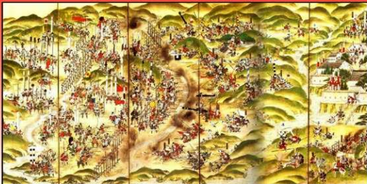
長篠合戦図屏風（日の丸の幟が両軍に掲げられている）

以後、代々の将軍は徳氏の末裔を名乗り、「白地赤丸」の「日の丸」が天下統一を成し遂げた者の象徴として受け継がれていったと言われる。