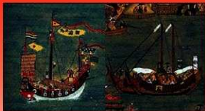
19世紀初頭の琉球王国の船幟（左）薩摩藩の船幟（右）

これらの記録等から、明治3年に国旗として制定される以前にも「日の丸」が用いられていたことも事実である。