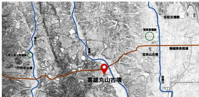
富雄丸山古墳の位置 (下図は地理院地図)