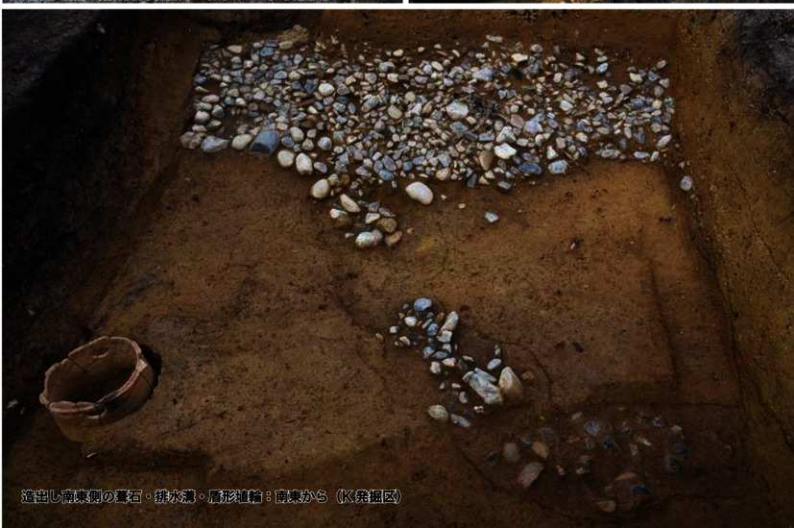
造出し南東側の墓石・排水溝・層形埴輪：南東から (K発掘区)