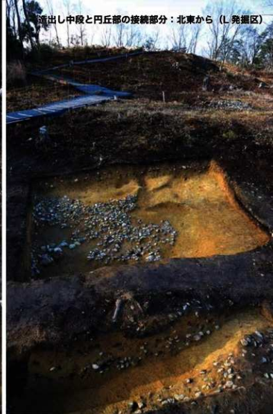
造出し中段と円丘部の接続部分：北東から (L発掘区)