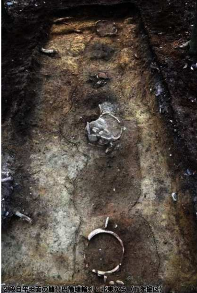
2段目平坦面の鎌付円筒埴輪列：北東から (T発掘区)