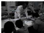
施設公開（石器レプリカ体験）