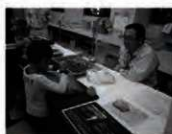
施設公開（ドングリつぶし体験）