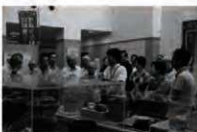
講演会での展示資料解説