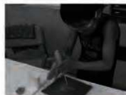
体験講座（石包丁をつくろう）