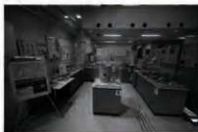
西米良会場の展示