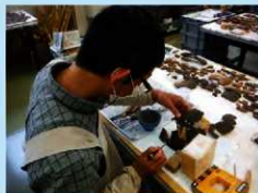
土器の破片同士をつなげていく