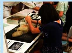
ドングリつぶし体験