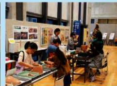
新富会場セレクション講座の様子