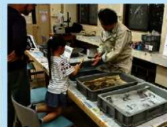
土器の水洗い体験