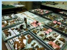
形ごとに分けられた縄文土器