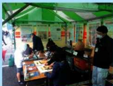
みやざき産業祭での出前展示

宮崎県埋蔵文化財センターでは、職員が宮崎県内から出土した土器や石器などの資料を持参し、学校や団体の皆様に地域の歴史についてお話しする「出前講座」を行っています。