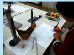
縄文土器の実測作業