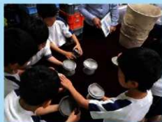
村所小学校での出前講座