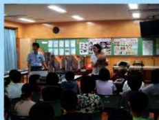
新田小学校での出前講座