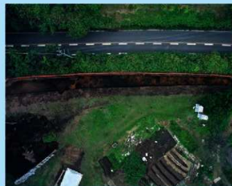
上空から見た竹下第2遺跡

遺物は弥生時代の磨製石鏃、古墳時代中期の須恵器、中世の土錘・青磁などが出土しています。調査終了後すぐに整理作業も始まっており、さらなる成果が期待されます。