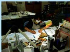
縄文土器の実測作業

本年度の整理作業は、土器の接合・実測・拓本などを中心に進めています。写真は土器の実測作業です。土器の表面にほどこされた細かい文様を正確に計測し作図を行いました。