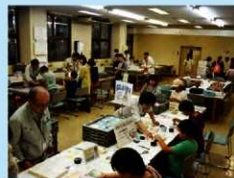
体験コーナーの様子

土器の水洗い、土器の文様写し(拓本)といったお仕事体験のほか、石器を使ったドングリつぶし、発掘疑似体験、石器レプリカ作りなどのお楽しみコーナーも用意しました。子供たちにはドングリつぶしが好評で、石器を上手に使い、ドングリが粉状になるまで黙々と石器を擦り続けている子がみられました。地味だけれど、何故かハマる…それが埋文のお仕事なのかもしれません。