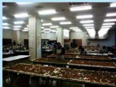
机に並べられた縄文土器

今年度から整理作業を開始し、遺物の洗浄・接合・実測・拓本・トレース等の作業を行いました。写真は縄文土器の接合作業を行っている様子です。同じ土器の破片を探し出し、元の形に近づけていくため、出土した場所や文様・形などで土器片を分けることから始めます。