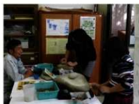
施設公開（ドングリつぶし体験）