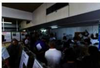
中間会場での展示資料解説