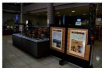
宮崎大学会場の展示