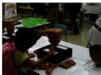
施設公開（土器復元体験）