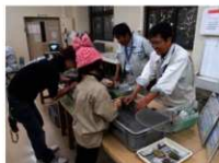
施設公開（土器水洗体験）