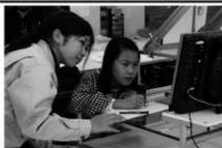
本館でのトレース体験