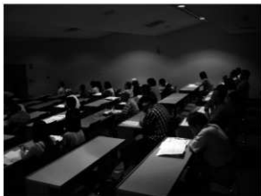
多くの方が、熱心に発表を聞いて下さった。