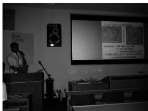
担当者が遺跡についてわかりやすく解説