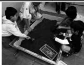
分館での発掘体験