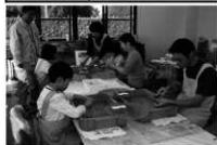
本館での水洗体験