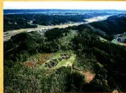
百塚原古墳群遺景(西より)

百塚原古墳群は、西都原古墳群の西側に位置する、西原・永野地区の丘陵上にある古墳群です。本年度の調査では、地中レーダー探査の結果に基づいて、8号墳を含む古墳4基と墳丘を失った古墳2基の周溝(古墳の周囲を巡る溝)調査を行い、地下式横穴墓(古墳時代の南九州特有の墓)5基を確認しました。このことから、現在の古墳は耕作などにより削られ、小さくなりました。無くなったりはしていますが、古墳時代の終わり頃(今から約1400～1500年前)には、直径約12～16mの多くの小古墳が密集して造られていた様子がうかがえます。