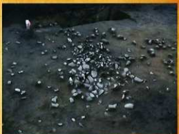
縄文時代早期の集石遺構

塚原遺跡は、国富町東部、東九州自動車道と県道が交差する平野部に広がる低湿地とその南西の丘陵上に立地しています。調査の結果、旧石器時代から近世にかけての土器や石器などの遺物が見つっています。調査区の低湿地側(H区)で古代～中世の溝状遺構や中世の水田が確認され、丘陵側(J区)では旧石器時代の礫群や縄文時代の集石遺構、古墳時代の墳丘などの遺構が見つかりました。