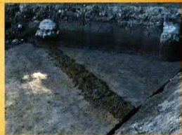
コンクリート基礎の下部に残存した畦畔

橘通東1丁目遺跡は、宮崎県庁の外來者駐車場南側の標高約5mに立地しています。中世を中心とした土師器や弥生時代から古墳時代にかけてのものと考えられる土器が出土しました。地表から約1.2mの深さに畦(田の畦)が見つかり、粘性の強い土層からは、イネのプラントオパール(植物細胞にふくまれるガラス質の物質)が検出されました。中世以前の水田が複数の面で見つかったことから、古くから水田耕作が繰り返行われていたことがわかりました。このほか、ウシのものと考えられるたくさんの足跡もみつっています。