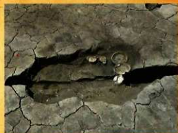
土坑内の出土状況

山之後遺跡は、西都市南東部に位置しており、丘陵南麓の低地に立地した遺跡です。今回の調査では、中世を中心として多くの遺物が出土しており、この頃から付近に人々が住んで活動していたことが明らかとなりました。一方、低地で遺構は少ないですが、その中の土坑1基から、土師器の皿が5点、埋められた状態で出土しています。この他にも1点のみですが、古代の瓦と考えられる遺物が出土しており、周辺に古代の瓦葺きの施設があったことが想定できます。