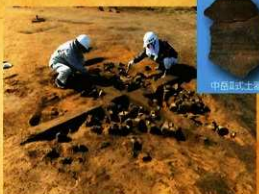
8号住居跡遺物出土状況

嫁坂遺跡は、都城市の南西部に位置し、野山系から派生する丘陵上に立地します。調査の結果、主に縄文時代後期から晩期にかけての遺構や遺物が見つっています。調査区はA～D区に分かれ、A区では縄文時代後期後半の中居Ⅱ式土器が、B・C区では縄文時代晩期の扇川Ⅰ式土器が出土する竪穴住居跡が確認されました。さらに、C区では縄文時代早期の散焼(焼けた稜の広がり)が見つっており、壱ノ神式土器や石版式土器なども出土しています。