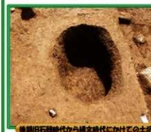
後期旧石器時代から縄文時代にかけての土器