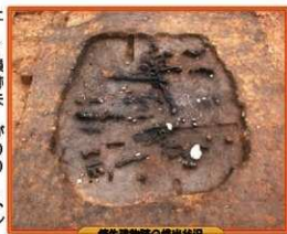
集石遺構跡の検出状況

本遺跡は、日向灘を望む崖上に位置します。この遺跡では、縄文時代前期の集石遺構を17基、弥生時代後期後半から古墳時代前期にかけての竪穴建物跡を7軒検出し、うち4軒は焼失建物でした。集石遺構のなかには掘り込みが炭化物でいっぱいのものでありました。火と人の密接な関わりを感じることができます。また、遺跡からは土器、石包丁、石斧など生活道具が出土しました。