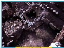
石作り礎梁と石垣マス

遺跡名 飯肥城下町遺跡 所在地 日南市飯肥 調査期間 平成22年7月12日～平成22年10月21日