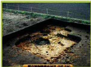
竪穴建物跡出土状況 (SA2, SA4)

遺跡名 木戸平第2遺跡 所在地 児湯郡都農町大字川北字木戸平 調査期間 平成22年10月12日～平成23年1月31日