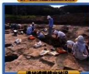
溝状遺構出土状況