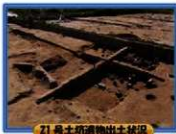
21号土坑遺構出土状況

宮ヶ迫遺跡では、これまでの調査の結果、古墳時代の溝状遺構や土器を埋めた炉を伴った竪穴建物、土器を焼いたとみられる焼成土坑や掘立柱建物、粘土採掘・貯蔵土坑などの遺構を検出しました。遺物は、古墳時代の土師器や須恵器、耳環が出土しています。粘土採掘・貯蔵土坑の検出から、土師器製作の工場があったのではないかと考えられます。