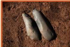
縄文前期 磨製石斧、検出状況