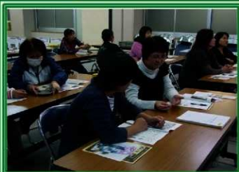
高鍋東中学校家庭教育学級の皆様

連絡先 宮崎県埋蔵文化財センター分館 普及資料課 TEL0985-21-1600