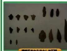
調査区画内から出土した石箭

遺跡名 舟川第2遺跡 所在地 児湯郡都農町大字川北字舟川、字境谷 調査期間 平成21年10月26日～平成22年8月23日