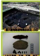
土から発掘、石壁・石礎・竪柱

木戸平第2遺跡では、竪穴建物跡が4軒検出され、3軒の建物跡からは炭化材が多数出土しました。また、屋根を形成していたと思われる単状の炭化材も出土している事から、これらの建物跡は何らかの理由で焼失した建物であることや、このうち1軒は建物を建てる時に、より古い建物跡の上に乗られたことが分かりました。また、この建物跡から鉄器や土器・石斧などの道具や、装飾品である管玉も出土しています。これらの事からこの遺跡は、主に弥生時代後期後半から古墳時代前期の集落とみられ、長い期間集落として営まれていたのではないかと考えられます。