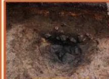
S14 集石遺構、検出状況