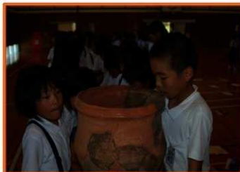
土器をのぞき込む子どもたち

夏休みが始まった7月23日に、門川町立五十鈴小学校へおじゃましました。地元の遺跡について話をしたり、実際に遺物を見たりしていただきました。(4・5・6年生児童対象)