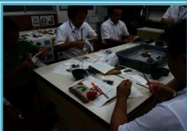
復元整理作業の体験の様子

11月17日の夜に高鍋町立高鍋東中学校の保護者の方を対象に行いました。高鍋町内で発掘作業を行った復元の遺跡について紹介し、実際に出土した遺物なども見ていただきました。(家庭教育学級対象)