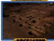
布織式掘立柱建物跡