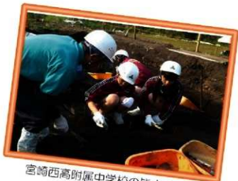
宮崎西高附属中学校の皆さんです♪

11月11日に県立宮崎西高等学校附属中学校の1年生80名が、都農町の猿石第2遺跡と木戸平第2遺跡の2遺跡に分かれて発掘体験を実施しました。