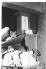
お札を配る。家の留守番や火の安全を守る。カマ神様のルスンギョウ(日影)

神宮の掛軸をかざり、オペンベロ(御幣束)がある。えびす講の時は床の間にえびす大黒をかざり、その前にお膳で供えものをする。麦を一駄売った金をそっくり穴あき銭で供えたものである。小正月にはまだまを上げる。(上高田字下十