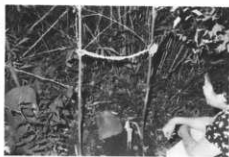
屋敷神(左)右手にシノ竹4本立ててシメ縄を張る(名称不明)(諸戸)