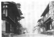
妙義通り (妙義)