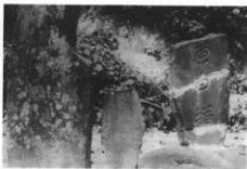
左 奉納千堂供養（北山）（猫神という）

鼠 ネズミは大黒様のご養族だから、大黒さまの前でネズミの悪口を言くと、鼠にかじられる。鼠があばれて困る時は、盃に爪がたたくくらいしつかりご飯をつめて、「鼠をしずめてくれろ」と言つて大黒さまに上げると、鼠が静かになる。（中里）