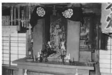
不動明王 随応寺山門内に祭る。戦時中に木剣奉納。 毎月28日が縁日。(諸戸)

りしなくなつた。伝統を絶やすなど五十代の人も入っている。昔はイモの煮つころがしや沢庵なんかでお茶をのんだり習ったりした。今は二百円から五百円ぐらい包んで念仏に行くと御馳走してくれて、引き物など出す家もあつて具合が悪くなつてあまりしなくなつた。(諸戸字日向)