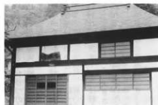
菅根堂 (中里)