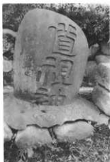
道祖神 (大久保)