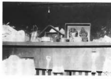
お勝手の上の棚にある恵比須大黒(日影)

神宮の掛軸をかざり、オペンベロ(御幣束)がある。えびす講の時は床の間にえびす大黒をかざり、その前にお膳で供えものをする。麦を一駄売った金をそっくり穴あき銭で供えたものである。小正月にはまだまを上げる。(上高田字下十