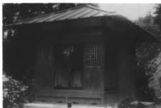
絵馬堂(陽雲寺) (埼玉県上岡観音動請による)