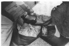
二十二夜様の道具 (下十二)