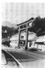
妙義神社の大鳥居

いう。現在行沢に波古曾神社がある。大牛部落の波古曾神社は、神主をおくのに費用がかかるというので、昭和初年、妙義神社からの働きかけもあつて、合併した。拝殿の建物はよそへ売った。むかしは波古曾神社の境内で獅子舞をした。(妙義) 「甘菜ノ七ハコソ」といって、妙義山のある甘菜郡に七か所のハコソ神社があるという。妙義・行沢・大牛・日影・諸戸・菅原・屋代・