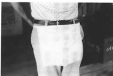
二十二夜様のオコシ (下十二)