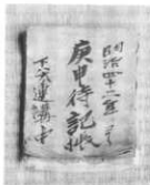
庚申講の帳面 (下八木連)

下八木連では、十三戸で春秋の庚申の日に庚申祭が行われている。宿は順番制で、米三合五勺、お金いくらかを負担した。明治四十二年からの記録があり、それによると、明治四十二年は金二銭、大正八年秋から金三銭、昭和十年秋十銭、三十年春五十円となり、現在は一切宿持ちということになっている。(昭和四十五年以来そうにきめた。)