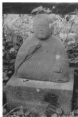
女人 孝(女) 3月 阿部 己(鉦) 供養(古立) 念仏(撮影)

念仏 随応寺にある不動様の畳を作る目的で念仏しながら浄財を集めた。法眼(念仏の師匠)が頭で年寄りの女の人はかりが入っていた。念仏は「四日・八日に十二日」といった。十二日は薬師様、十六日は