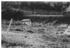
弘法井戸周辺 建物のところが井戸 (大久保)

水をかぶったあと、体を拭いてはいけない。裸のまま芝の上で、どいんどいと跳びはねて水をきり、体温で体が乾いたところを着物を着る。不思議なもので風邪をひくことはなかった。 水行はスイギョウは、今の修験の人や修業僧がやる修業と同じもので、朝晩ダンナの水をかぶるが、晩には、昼間のことでザンゲして罰をうけるとカズミズをかぶる。多い時は六十杯というのがあったというが、三年間にダンナの水を四十五杯かぶることになっていた。二年ではふつうはかぶりきれないが、閏年で節分がおくれた年はかぶりきれようになっていた。