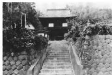
随応寺山門 内部に不動尊を安置する。 (諸戸)