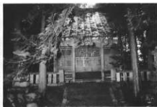
伏見神社々殿(下高田)

伏見神社 千福寺の磨崖神社、三つ屋・久原の鹿島神社、虻田の賀茂神社、山下の諏訪神社が合併したもので、以前は当番が順番で毎月一日、十五日に灯明をあげた。今はそれもなく、三月・十月の十五日の祭日にあがるだけになった。