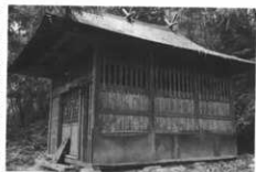
波己曾神社 (行沢) 額に「破胡曾大明神」とある。

いう。現在行沢に波古曾神社がある。大牛部落の波古曾神社は、神主をおくのに費用がかかるというので、昭和初年、妙義神社からの働きかけもあつて、合併した。拝殿の建物はよそへ売った。むかしは波古曾神社の境内で獅子舞をした。(妙義) 「甘菜ノ七ハコソ」といって、妙義山のある甘菜郡に七か所のハコソ神社があるという。妙義・行沢・大牛・日影・諸戸・菅原・屋代・