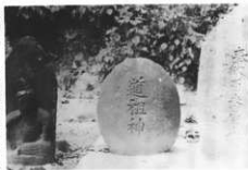
石 仏 (北山)