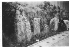
大字菅原字宿の供養塔(左)と道祖神(右)

エが出され、また道祖神と呼ばれる一組の扮装した嫁と婿が御祝儀のあつた家やタテジ(上棟式)のあつた家を回つてお祓いをした。ヤチエは上手の宿から尾崎まで引かれ、尾崎で折り返して戻つてきた。若い衆はヤチエに乗つて太鼓・笛などでお囃子をし、世話人がカジ役を握り、子供等が綱を引いた。道祖神には嫁も婿も男がなる。この役をするとき嫁が来るといわれ、若い衆が扮したが、なりてのいない時は世話人同士がくじを引いて決めた。嫁は、女衆の着物を着て髪も女形にし、姉さん被りに手拭いを被り、コダカラと呼ばれる五十七センチ程の長さのヌリデンボウの太い木(男衆の道具)に着物を着せたものを抱いた。婿は、神主の装束に烏帽子を被り、カシツ葉にオンペロを付けたものを持った。新しい嫁をもらった家に行くと、ザシキで道祖神の嫁が抱いてきたコダカラを新嫁に渡し、婿がその前でお祓いをした。これが終ると酒肴がふるまわれた。この道祖神祭りのうちヤチエの方は戦前までにやらなくなつていたが、嫁と婿の道祖神の行事は昭和二十五年前後まであつた。盛んな時には、他の町村からの見物人で一晩