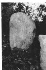
享和元年 寒念仏供養塔 (大久保)