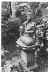
二十二夜塔 「回向女人講中 弘化五申二 月吉日」と銘あり。 (諸戸 隨応寺門前)

えてお祭りをするようになったところ、お産でなくなる人がいなくなつたと伝えられている。近年まで毎月二十二日の昼間、宿をきめて掛軸をかけロウソク(長ロウソク)や線香を立てて拜んで念仏を唱えてお祭りをして来た。このロウソクは短かくなるとつておき、お産の近い人がもらつて行つてこのロウソクを燃やすと、ロウソクの燃えきらないうちに産ませてくれるといつて方々からもらいに来たりした。また晒布などで小さいオコシ(腰巻の小さ