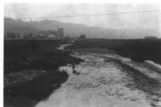
石尊行をした高田川

昔は七月土用、二十日ごろ、麦わらで俵の径二〇センチくらいのをつくり、紙でまいて長い竹にさしてオボンデン(御幣)をさげ、川の流れて立てて、まわりから水をかけて、「サンゲ サンゲ ドッコイ サンゲ」などと唱えた。オボンデンは川原においてくる。本村全体でやつた。そのあとといっしょに飲んだり食つたりした。(下高田字本村)