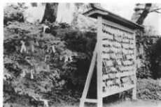
妙義神社のおみくじと給馬

その時西横野の別所(松井田町)の橋くぐりをして来る。橋には鹿の足あとがあるといわれ、橋には鹿が軽くすむというので連れて行くもので、そのついでに妙義へ行つて来るともいえるという。十年くらい前までは行っていた。(上高田字下十二)