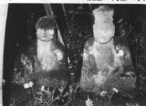
シヨウツカノバアサン・ジイサン 墓地の入口にある。カゼの時真綿の帽子をかぶせて拜む。(諸戸 随応寺裏の墓地)

れてお参りをした。埼玉の上岡の観音にも安全祈願に行きお札を受けたり、笹の葉を買って来て、馬の腹に与えることもあった。(中里) 菅原の陽雲寺に馬頭観音があり、お祭りに馬を連れていった人もいるが、下十二からは連れていかなかった。(上高田)