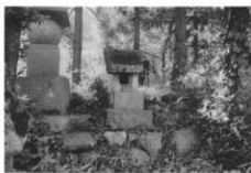
墓地にある先祖まつりの石宮(大久保・岩井家)

先祖祭り 大久保の岩井家では、先祖祭りを九月十五日に行った。墓地にある先祖祭り用の石祠に、赤飯、煮しめなどを供え、線香をあげて拜んだ。また、石祠のそばに先祖祭りの旗を立てた。旗はダブル幅の長さは九尺ぐらい。紺地に文字が白く染めぬいてあった。文字は、何んと書いてあったか思い出せない。先祖祭りは岩井家でも、この旗を持っているうちだけが「うちつきり」でやった。時には他の岩井家のものを呼んだこともある。旗を持っている家は二軒ある。(八木連字 大久保)