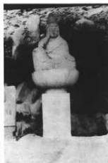
安産の観音さま (上八木連)

北向きの観音様 厄除けで有名。竹松にあり、一月一日がお祭り。共有田ができた時からお祭りしている。昔競馬をした頃はこの観音様をモッコに入れて四、五人でかついで行って競馬場に立てておくとケガがない、と言って運んだものだった。参詣者が沢山いて五十六年にはオサイ銭が十