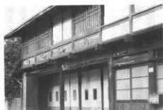
昔の宿屋 (妙義)

を横断し、中央部には宿がつくられ、屋並みも宿場風に立並んでいる。もう一本の主道は、妙義神社の門前町から東に町の中心部の高田地区を通り、富岡に通じ、現在ではこの県道が町の中心道路になっている。これらの道が、かつては妙義山や妙義神社への道であり、神社の下の門前町には旅館や土産物の店も並んでいるが、かつて妙義講のさかんなころは宿泊する人も多かった。いまでは自動車の発達により宿泊客も減少したが、夏には学生などの合宿所として一時的には賑う。一般の参詣人はやはり秋の妙義に訪れる人が多い。