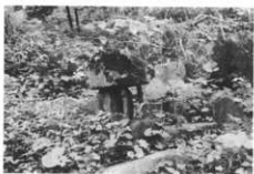
オシリョウ様、ロジ(ツボ庭)の奥に祭る。(諸戸字日影 星まつ家)

屋敷のロジ(ツボ庭)の奥に前からオシリョウ様という石を祭っていた。左横に高さ三十センチほどの石が立ててあるが、これは不明。オシリョウ様は屋敷祭り(十二月十五日)の時、笹竹を二本立ててシメ縄をはり、オペンベロ(御幣)を立てる。三が日には供え物をする。どういふものか不明。祖父は倉沢村から来たが、その前からあった。(諸戸)