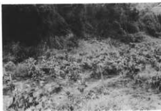
寒行の行屋跡 (大久保)

て拜んだ。西の方に足を向けては寝なかつた(オデシは寺で寝た)。行に必要なもの、道具としては水の桶、柄杓などで、生活する用具として鍋、茶わん、箸がある。どれも寒行の用具としてきめられたものがあつたが、箸は古くなると時々新しくした。そんな時は、塩をふつてきよめた。