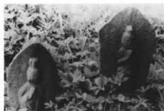
馬頭観音 (寛政5年) (中里)

馬頭観音 埼玉県上岡の馬頭観音を信仰していた。陽雲寺に、この観音の分霊がまつられている。ここではお札は出さなかったが、四月一日と二月十八日には馬を連