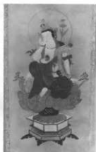
二十二夜様の掛軸 (下十二)