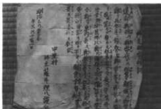
先祖霊神の祝詞(明治3年)(中里)

北谷の広木家(七戸)はもと九月九日であったがその後十月九日となる。千福寺、舞台の藤井家(六戸)は十一月十五日、舞台の須藤家