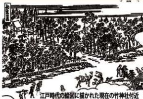
江戸時代の絵図に描かれた現在の竹神社付近

斎宮城の特定はできませんが、神社の場所が交通上の要地だったことは間違いありません。竹神社はかつて斎宮の中枢である内院があったとされます。この場所は、斎宮がなくなっても形を変え何度も歴史上に登場する重要な地なのです。