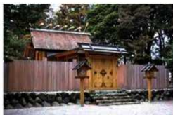
斎宮城があったとされる竹神社

では、竹神社の中に城の痕跡は残されていないのでしょうか。境内の西側をよく観察すると、土を盛った高まりが南北にあります。もしかすると、この高まりが城の土塁 どるい かもしれません。さて、一部の解説で境内の石垣を斎宮城と説明していますが、斎宮城に関するものではありません。この頃の城は田丸城や松坂城などのような石垣はなく、土塁や空堀のみでした。現時点で調べられる範囲においては、斎宮城が竹神社にあったと断定できません。では、なぜ「竹神社=斎宮城」説ができたのか、神社の場所に焦点を当てて考えてみましょう。