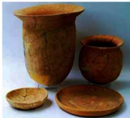
水池土器製作遺跡から出土した土器

現在では販売用の土器は作っていませんが、養村には今も神宮土器調整所があり、約1300年前からの技術を受け継いで土器が作られ、伊勢神宮に奉納され続けています。