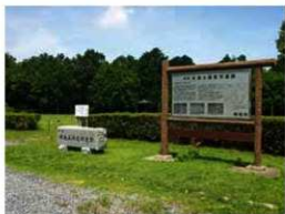
公園整備された水池土器製作遺跡