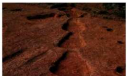
発掘調査で見つかった窯跡