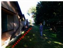
竹神社の境内西側に残る土塁状の痕跡