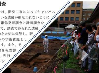
▲遺跡の発掘調査。土を掘り下げ、遺構や遺物の有無を確認する。

調査センターは、開発工事によってキャンパス内に包蔵されている遺跡が損なわれないように保護するため、緊急発掘調査と計画調査を行います。そして、調査で得られた遺跡のデータや遺物を大切に保管し、研究・教育のための学術資源として活用しています。また、それらの調査成果を報告書としてまとめ、刊行物やホームページなどで一般に公開しています。