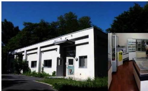
▲北海道大学埋蔵文化財調査センター