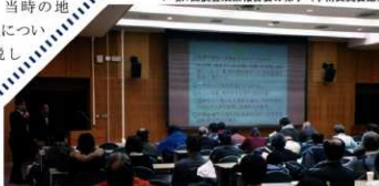
▼第7回調査成果報告会の様子（学術交流会場）

毎年夏と秋の2回、北大キャンパス内にある遺跡の詳細を記したサテライトサインを、その時々々のテーマに基づいて訪ね歩きます。センタースタッフや道案内役となり、サクシュエに沿いに残された生活の痕跡や、当時の地形と植生についても解説します。