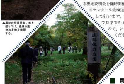
▲遺跡巡りとともに自然を満喫

発掘調査の期間中には、進捗状況にあわせて発掘現場を公開し、学生・教職員・一般市民の方々に調査成果を解説する現地説明会を随時開催します。開催のお知らせは、当センターや北海道大学のホームページを通して行います。調査中の遺跡を間近で見学できる貴重な機会ですので、お気軽にご参加ください。