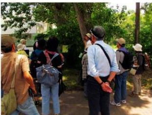
▲サテライトサインでの解説

北海道大学埋蔵文化財調査センターでは、恒例行事となりました遺跡トレイルウォークを開催いたします。北大キャンパスに設置されているサテライトサインを巡りながら、センター員による解説と豊かな自然をお楽しみいただけます。テーマは『北大式土器を訪ねて』です。参加費は無料ですので、お気軽にご参加ください。