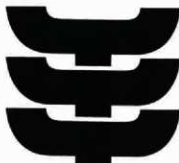
文化財愛護シンボルマーク

あひわ 明和7年(1722)5月21日(陰暦)、現在の ながたに 長谷小出ヶ谷地区において銅鐸一口が発見され、掛川藩に届け出されました。掛川市教育委員会では、この日を記念して、市民の埋蔵文化財に対する理解と保護・保存しようとする意識の向上を願い、出土文化財展を開催しています。