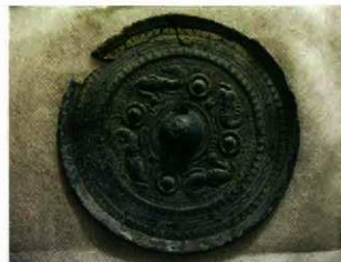
発見された斜縁四脚鏡

岡津原は、原野谷川が形成した独立丘陵です。鏡は、丘陵の西縁辺部の茶畑脇で発見されました。古墳時代中期に製作され古墳に埋葬されたと考えられる斜縁四脚鏡で、直径12cmのほぼ完全形です。岡津原には、縄文時代から古墳時代の遺跡が広がっていますが、これまで奥ノ原古墳(消滅)で画文帯神獸鏡、西岡津古墳(消滅)で変形獸文鏡が発見されています。現在も丘陵縁辺部には、古墳や横穴が立地していますが、鏡の発見された場所には古墳の存在は知られていません。今回の発見は、既に消滅した有力古墳の存在を裏付けるものです。