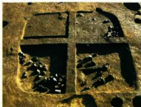
火災にあった堅穴住居跡

調査では、古墳時代前期の堅穴住居跡4軒、掘立柱建物跡1棟と多数の小穴を確認しました。全体の大きさが確認できた堅穴住居跡は2軒で、その平面の形は、ほぼ正方形でした。大きさは、1軒が4m四方、もう1軒は6m四方です。4m四方の住居跡からは、炭化材が多く出土したことから、火災にあったと考えられます。6m四方の住居跡からは桃の種が2つ、土器と共に出土しました。桃は魔よけの力があるといわれており、祭祀に使用されたのかもしれない。