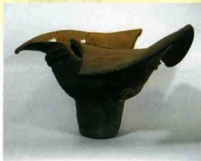
口縁部が大きくゆがんだ朝顔形埴輪

星川窯跡は、古墳時代後期（約1,450年前）に操業していた窯で、掛川市内では唯一、埴輪を生産していました。調査では、長さ2.5m、幅約1mの窯体を確認され、4回以上修復して使用されていたことがわかりました。窯跡に残されていたものは、製品として使用できない焼き損じ（不良品）で、大きくゆがんでいたり、割れていたりしているものばかりでした。出土した須恵器の作り方から袋井市にある あもんぼか 衛門坂古窯跡で須恵器や埴輪を製作していた人々が、星川窯跡を開いたと考えられています。ここで製作された埴輪は、菊川市の高田ヶ原古墳（菊川市半済）で、使用されています。古墳時代後期の埴輪の流通を知る貴重な資料です。