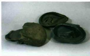
不良品として残されていた須恵器

あひわ 明和7年(1722)5月21日(陰暦)、現在の ながたに 長谷小出ヶ谷地区において銅鐸一口が発見され、掛川藩に届け出されました。掛川市教育委員会では、この日を記念して、市民の埋蔵文化財に対する理解と保護・保存しようとする意識の向上を願い、出土文化財展を開催しています。