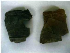
窯跡に残されていた埴輪片