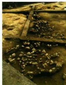
土器が出土した様子