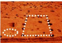
掘立柱建物と粘土溜