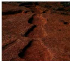
連なって造られた土器焼成坑

このように、水池土器製作遺跡では、土器生産に伴う一連の行程に関連する施設が揃っている特徴が認められ、昭和 52 年に国史跡として指定され、公園として整備されています。