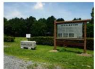
現在の水池土器製作遺跡