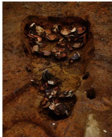
古堀遺跡で見つかった土師器焼成坑