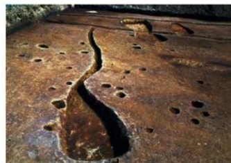
前壁から溝がのびる土師器焼成坑