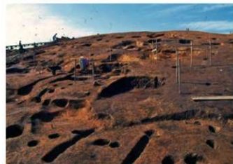
斜面に沿って造られた土師器焼成坑

土師器焼成坑は、奥壁部分が斜面の高い部分になるように作られており、前壁部に溝を伴う特徴的なものも見つっています。