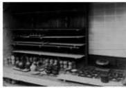
乾燥中の神宮土器