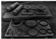
土器を作る道具類