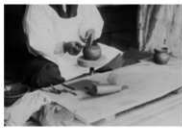
成形中の神宮土器

古代から続けられた伊勢神宮への土器の奉納は、明治維新以降は養村の二軒だけとなりながらも守り伝えられてきましたが、現在は町民が土器を製作することはなくなってしまいました。しかし神宮司庁が昭和12年に設置した養村の「神宮土器調製所」で今も土器が製作され、明和町と伊勢神宮との深い関わりが続いています。