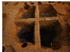
見つかった土器窯