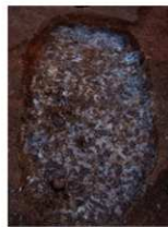
粘土を溜めていた土坑

遺跡は標高約 20mの独立した丘陵上にあり、鳥墓神庫推定地が近くにあります。商業店舗の新築に伴い平成 24 年に発掘調査を行いました。調査では長方形の大きな土坑が見つかりました。穴の底一面に焼けた炭の破片があり、出土した土器から 15～16 世紀頃の土器窯と考えられます。規模は、長辺約 3.1m、短辺約 2.4mの略方形をし、古代の二等辺三角形をした土師器焼成坑とは形態が異なります。その他、土器を作る粘土を溜めておいた土坑も見つかっています。調査の成果から、今までわかっていなかった当該期の土器生産の一端が分かってきました。