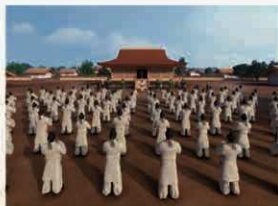
齋宮VR(バーチャルリアリティ)でよみがえる平安時代の齋宮

さいくう平安(ひらな)の社(かみ)では、貸出用(かじしゆよう)タブレットを使って齋宮VR(さいきゆうVR)を体験(たいけん)することができます。復元(ふくげん)された建物(たてもの)と見比べ(みくらべ)ながら、齋宮(さいきゆう)でどんなこと(こと)が行(い)われていたか(か)を見てみ(み)よう。