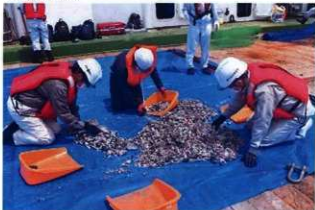
▲遺骨・遺留品調査