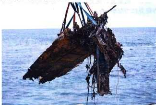
▲クレーンで引き揚げられた機体