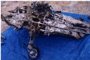
▲尾翼（水平尾翼と後輪）