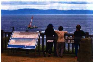
▲喜志鹿崎灯台から作業を見守る住民ら