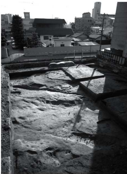
2次調査 全景（西より）