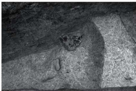
SK25 土器出土状況 (西より)