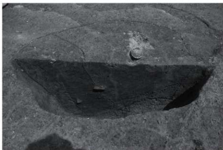
P63 土層断面 (西より)