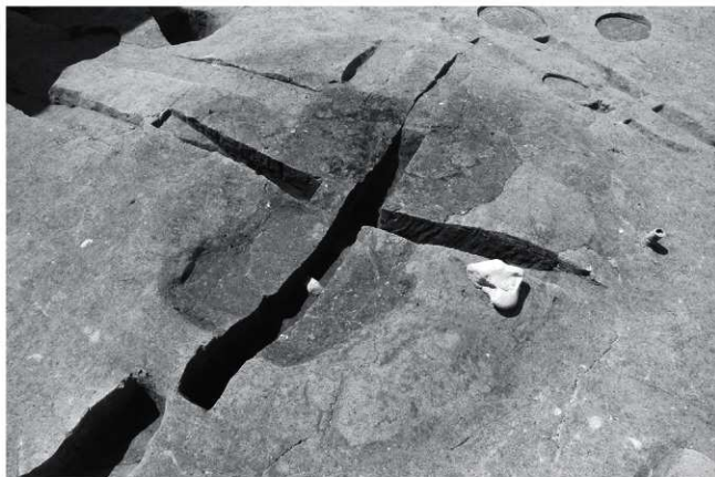
SH2炉 炭層除去後 (北より)