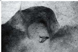
SK20 台石・磨石出土状況（北より）