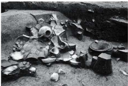
S02 遺物出土状況（南より）