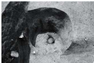
SK20 土器出土状況（北より）