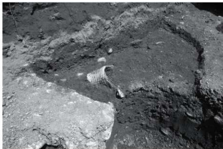
SK13 土器出土状況（南より）