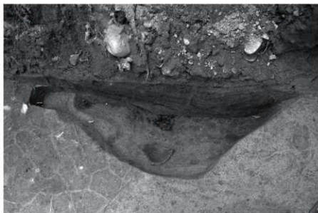
SK14 炭・土器検出状況（北より）