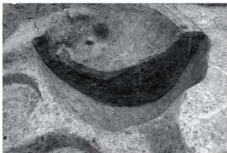
SK15 土層断面（北東より）