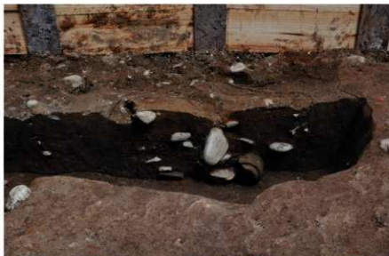
SK2・3土層断面（西から）