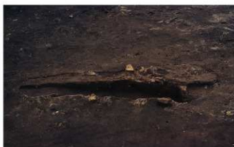
⑥ 3次調査 SL14炉跡断面状況 (西から)