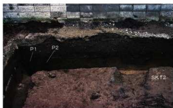
⑤ 3次調査 竪穴住居跡・土坑断面状況 (東から)