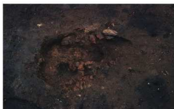
⑦ 3次調査 SL15炉跡完掘状況 (南から)