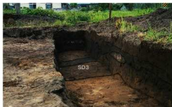
③ 2次調査 東トレンチSD3溝跡検出状況 (南から)