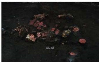
② 2次調査 SL13炉跡検出・遺物出土状況 (東から)