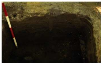
① 1次調査 2トレンチ南壁断面状況 (北から)