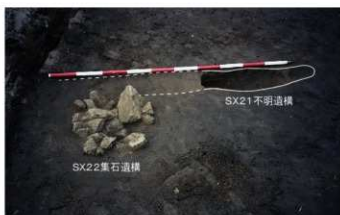
⑧ 4次調査 不明遺構・集石遺構検出状況 (南から)