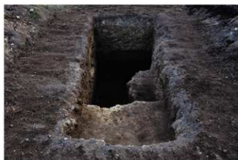
⑦ 31トレンチ全景（北東から）