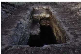
⑥ 31トレンチ全景（南西から）