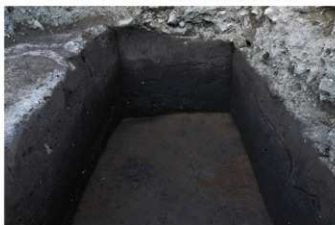
④ 30トレンチ 地山検出状況（南西から）