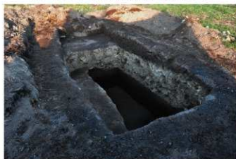
③ 30トレンチ全景（西から）