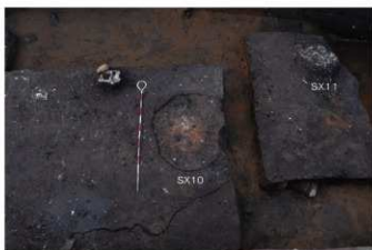
② 29トレンチ SX10・11検出状況（南東から）