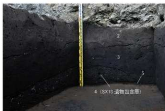
⑤ 30トレンチ 西壁・北壁断面状況（南から）