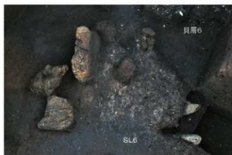
① 29トレンチ SL6伊跡礎除去後状況（北から）