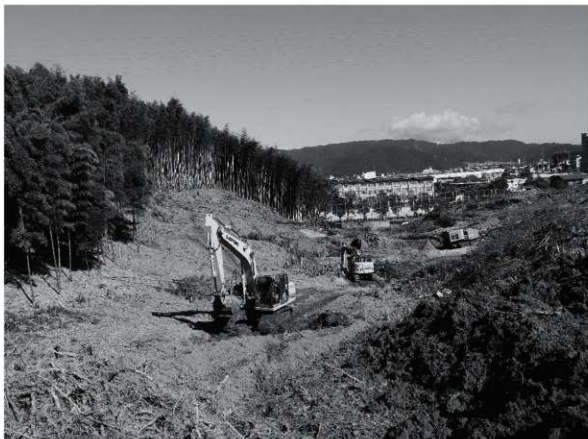
3 試掘前風景 南から（造成場所は包蔵地範囲外）