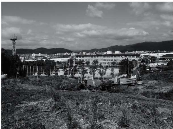
4 丘陵部から大宅中学校を望む 南から