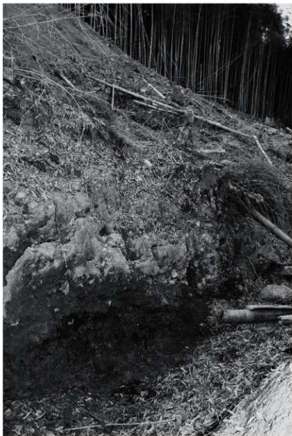
8 E地点灰原検出状況 南東から