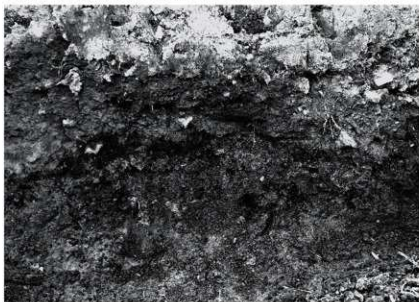
9 E地点 断面 東から