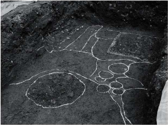
1 調査区第1面全景（北西から）