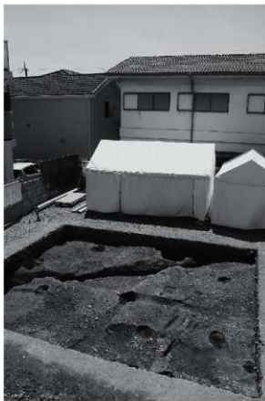
1 拡張前全景（北西から）