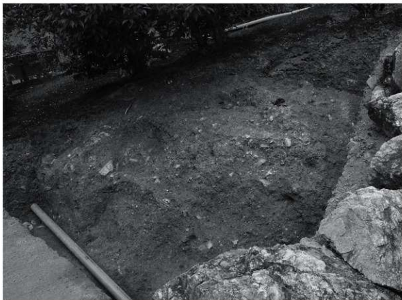
2 第1トレンチb区（南から）