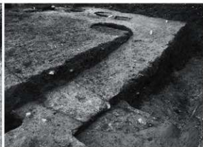
4 25次 整地土断面及び井戸検出状況 (南東から)