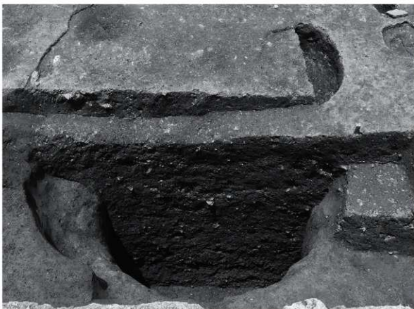
2 25次 SE17断面状況（東から）