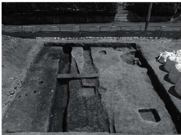
1 調査区全景 (西から)