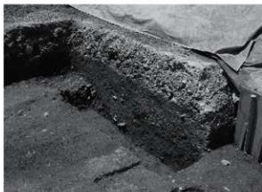
1 25次 調査区西壁 (E-F間) 断面状況 (北東から)