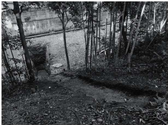
1 24次 2区土塁検出状況(南東から)