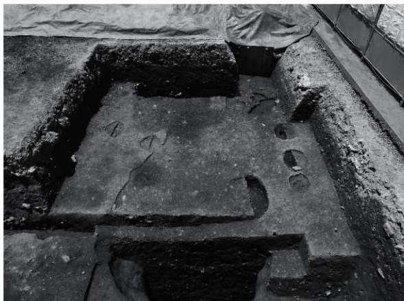
2 25次 拡張区1 遺構検出状況（東から）