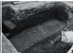
8 拡張区2 整地土検出状況 (北西から)