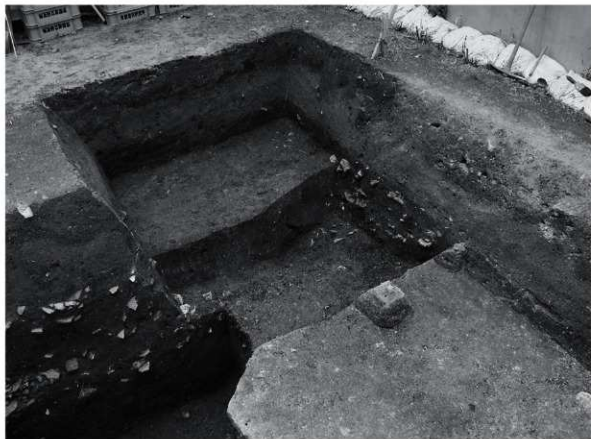
1 拡張区 SD 2 (北東から)