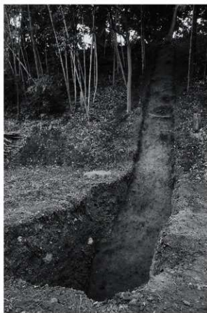
2 24次 2区土塁検出状況(北西から)