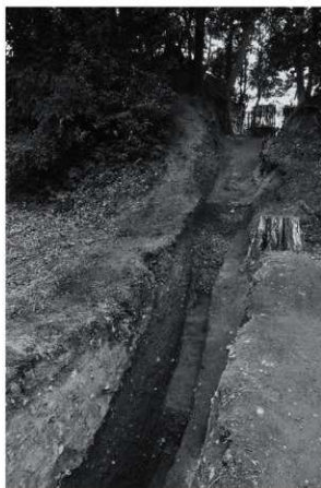
2 24次 1区土塁断面2（北西から）