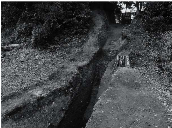
1 24次 1区土塁断面1（北西から）