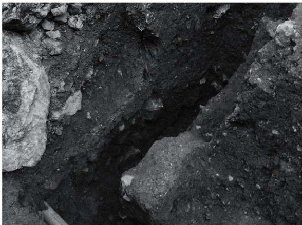
1 第1トレンチa区断割西壁全景（南東から）