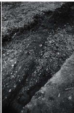
3 24次 1区土塁基底部断面（北西から）