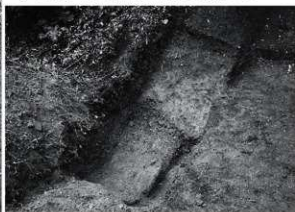
4 24次 3区検出状況(北西から)