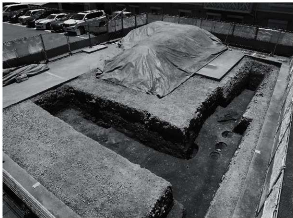
1 25次 調査区 遺構検出状況（北東から）