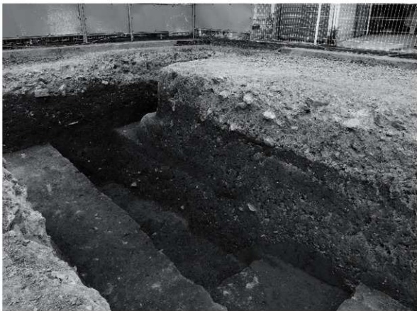
1 25次 調査区東壁及び断割り断面状況（南西から）