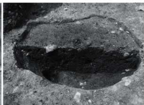
6 SK 8 断面状況 (南東から)