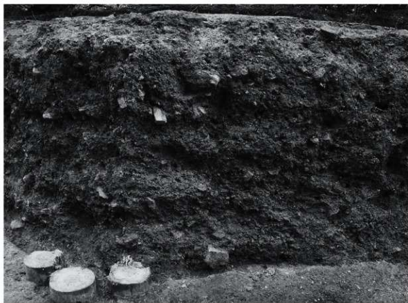
2 第2トレンチ盛土層近景（東から）