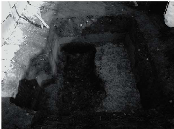
2 拡張区 SD 6 (南から)