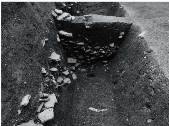
2 SD 2セクション断面（東から）