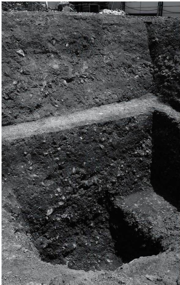
1 A-A' 断面 (旧二条城濠跡SD18) (北西から)