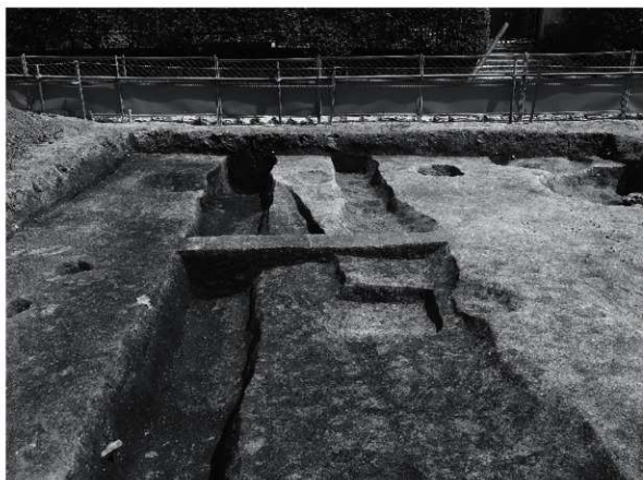
2 SD 5・6 (西から)