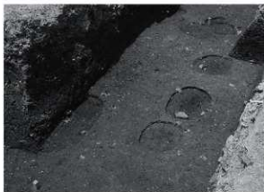
3 25次 調査区遺構検出状況 (北東から)