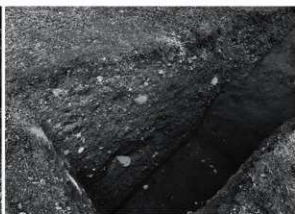
3 24次 2区土塁断面状況(北西から)