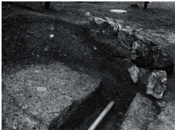
1 第1トレンチa区東壁（西から）