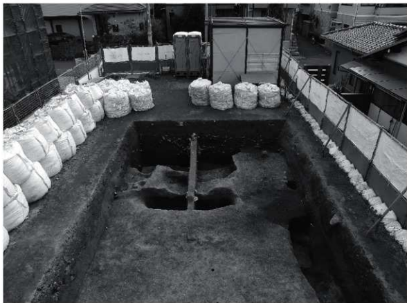
1 調査区全景（北から）