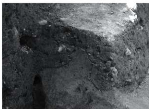
5 25次 SE17北肩検出状況 (南東から)