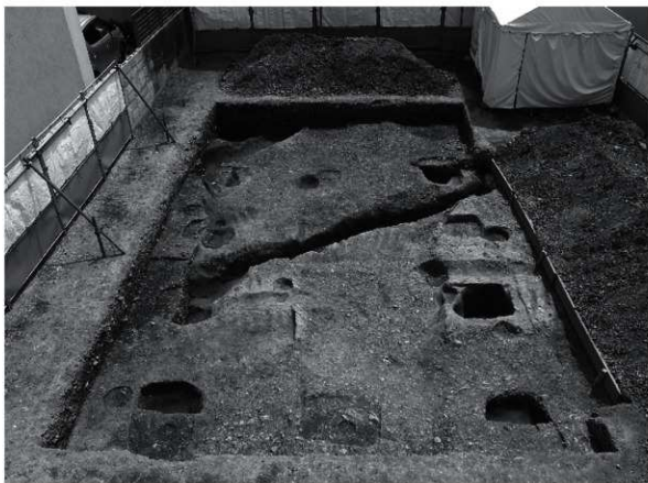
3 拡張後全景（掘立柱建物37）（北から）