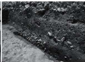
2 25次 調査区西壁 (H付近) 断面状況 (北東から)