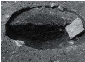
7 SK 9 断面状況 (南から)