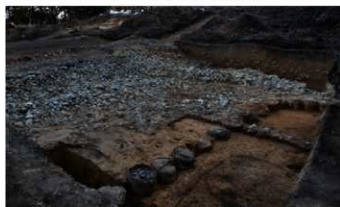
造出し北西側の葺石と植輪列（北から）