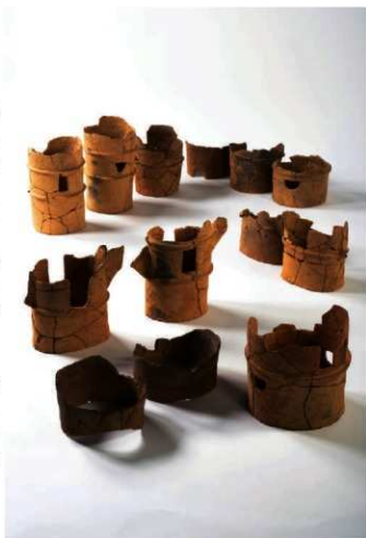
造出し北西側で出土した埴輪

形象埴輪は、家・蓋・盾・草摺等が出土しており、いずれも形象埴輪のなかでは最古型式に位置づけられるものです。