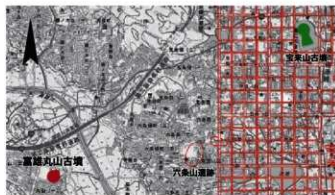
富雄丸山古墳位置図 (1/40,000)

造出し 造出し北西側では、斜面が2段になっており、葺石が良好に残存していました。また、墳丘1段目平坦面の植輪列に接続するとみられる植輪列も確認しました。一方、反対側（南東側）の斜面では段築を確認できず、左右非対称の構造となる可能性があります。