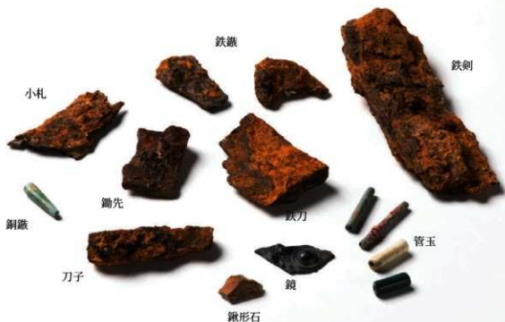
第2・3次調査で出土した副葬品