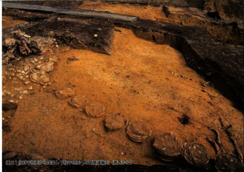
掘出1段目平坦面から透視し下段平坦面への円筒植栽列 (南西から)