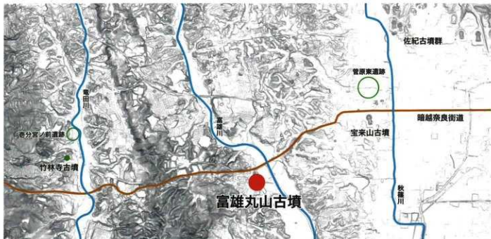
富雄丸山古墳の位置 (下図は国土地理院地図)