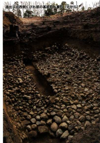
造出し北西側くびれ部の基底石と墓石 (北から)