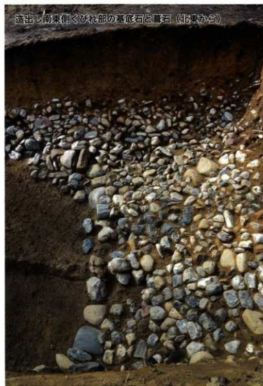
造出し南東側くびれ部の基底石と墓石 (南東から)