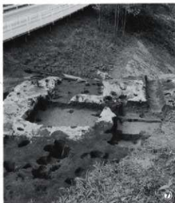
①第6号竪穴建物跡土層A-B（南から） ④第7号竪穴建物跡土層A-B（西から） ⑥第7号竪穴建物跡平面（東から）