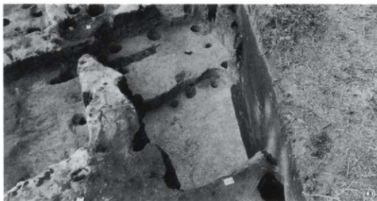
①第9号竪穴建物跡完掘（南から） ②第8号、10号竪穴建物跡土層C-D（南西から） ③第8号、10号竪穴建物跡完掘（南から）