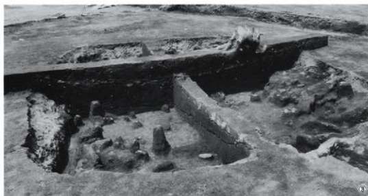
①第2号竪穴住居跡内火山灰（西から） ②土層C-D（南から） ③土層A-B（東から）