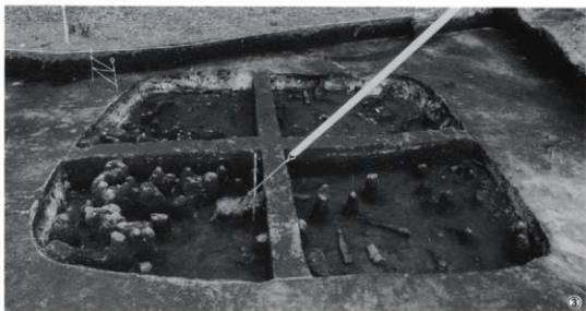
①第3号竪穴住居跡検出（西から） ②火山灰検出状況（東から） ③土層断面（西から）