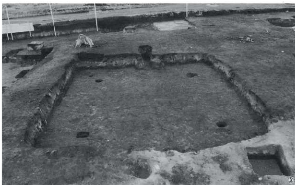
①第1号竪穴住居跡土層C-D (南から) ②土層A-B (西から) ③完壁状況 (南から)