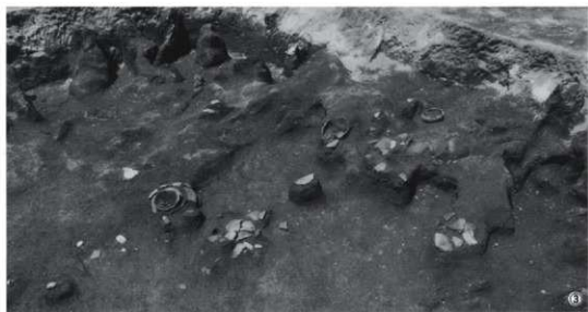
①第2号竪穴住居跡完掘（東から） ②床断割り状況（東から） ③遺物出土状況（東から）