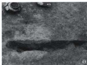
①第2号竪穴住居跡遺物出土状況（南から） ⑤床面焼土及び遺物（東から） ⑥床面焼土断割り（南から）