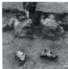
①第1号竪穴住居跡炭化材出土状況（西から）