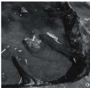
①第3号竪穴住居跡カマド (南から) ③煙道土層断面 (西から) ⑤遺物出土状況 (北西隅)