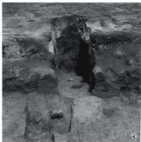
②カマド検出（南から） ③カマド精査（南から） ④カマド断割り（南から）