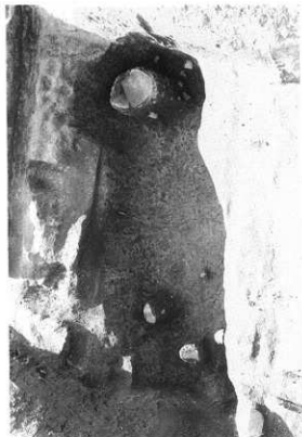
図版48 G-Bトレンチ貯蔵穴