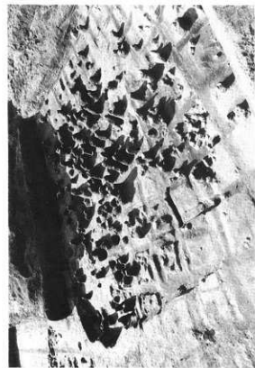
図版45 1号住居出土状況