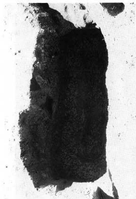
図版42 G-Aトレンチ4号土壕