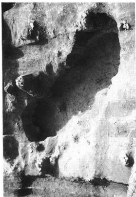
図版47 G-Bトレンチ8号土塊