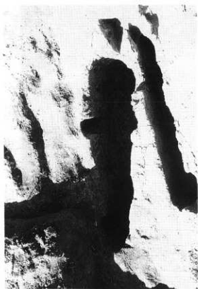
図版41 G-Aトレンチ1号土壕