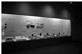
写真5 特別展「あつまれ！古代のかお」