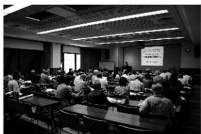
写真11 「わかりやすい考古学講座」(6月)