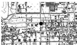
図1 調査地位位置図

概要 本調査は、松山外環状道路（空港線）余戸西工区整備事業に伴い実施した埋蔵文化財の発掘調査である。同整備事業に関連する発掘調査は平成 26 年度に始まり、これまでに余戸中の孝遺跡（1・2 次調査）、余戸柳井田遺跡（1 次調査）が実施されている。余戸中の孝遺跡からは、鎌倉時代の建物址や溝、土坑のほか、円形状に巡る溝を伴った土坑墓が検出されており、土坑墓からは埋葬された状態の人骨が出土している。一方、余戸柳井田遺跡では、室町時代の水田址などが発見されている。