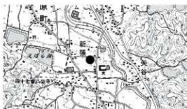
図1 調査地位位置図

概要 本調査は、愛媛県中予地方局が農地整備事業（通作条件整備）松山南部3期地区農道工事に伴い実施したもので、調査以前は水田として利用されており、現況の標高は、70.50～70.80mである。調査は4区画（1～4区）に区分して実地され、遺構は竪穴建物5棟、掘立柱建物2棟、溝8条、土坑33基、古墳1基、柱穴86基を検出し、遺物は弥生土器や土師器、須恵器、石器、白玉が出土した。本調査では、弥生時代から近現代までの遺構や遺物を確認した。弥生時代では、2区検出のSB201は推定直径6mの円形建物で、弥生時代後期初頭から前半の土器片が出土した。古墳時代では、1区検出のSB101は一辺6mの方形建物で、古墳時代中期後半、5世紀後半の土師器や須恵器が出土した。SB101内からは炭化物や焼土が比較的大量に検出され、火災を受けた消失住居と考えられる。3区では、2棟の竪穴建物を検出した。SB301は一辺6.3mの方形建物で、古墳時代後期中葉（6世紀中葉）の土器が出土し、SB302は一辺6.1mの方形建物で、古墳時代後期前半（6世紀前半）の土器が出土した。SB101とSB301は造り付けのカマドが残存しており、当時の厨房施設の状況が知れる貴重な資料といえる。4区では、古墳1基を検出した。遺存状況が悪く、古墳の形状や規模等は不明であるが、埋葬施設は横穴式石室である。調査では支室の一部を検出し、開口方向や外郭施設等は定かではない。石室内からは遺物の出土はなく、石室周辺に残存する墳丘構築に伴う盛土の一部からは古墳時代後期後半から末に時期比定される土器が出土し、確実に存在していた古墳と考えられる。調査地内には弥生時代中期から後期、古墳時代中期から後期にかけて、確実に集落が営まれていたが判明した。 まとめ 今回の調査成果は、恵原町一帯を含む松山平野南部地域における弥生時代や古墳時代の集落様相や変遷を解明するうえで貴重な資料といえる。