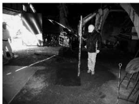
写真 2 掩体内部のトレンチ掘削状況 (東より)