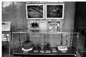
写真6 発掘情報展「東山古墳公園」