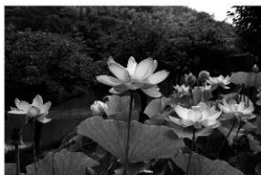
写真 23 大連古代蓮