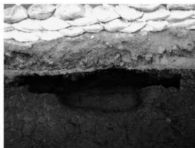
写真 2 SK2 完掘状況 (南より)