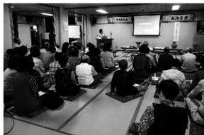
写真13 「地域のたから再発見」(雄郡公民館)