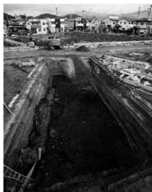
写真1 調査地全景（南より）

まとめ 今回の調査により、標高2m前後といった低地に弥生時代から古墳時代集落の存在する可能性が高いことがわかった。海岸線に近い地域での発掘調査例は極めて少なく、今後、松山平野における海岸沿いの集落様相や変遷を解明するうえで重要な遺跡といえよう。