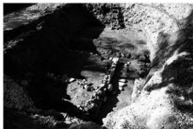
写真 1 遺構完掘状況（東より）

まとめ 東西溝から出土した多量の陶磁器類は一括性があり、当時の生活や流通などを解明できる資料となり、年代測定の判断材料となる。今回の調査において北御門広場南端を区画する東西溝の西端付近の様相が分かる資料を確認でき、史跡整備において貴重な資料となり得るものである。