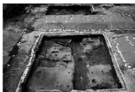
写真 1 1・2 区遺構検出状況 (北より)

まとめ 今回の調査で見つかった江戸時代の溝は調査地周辺では検出例がなく、形状や用途等については今後の研究課題となる。