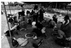
写真 20 歴史バスツアー