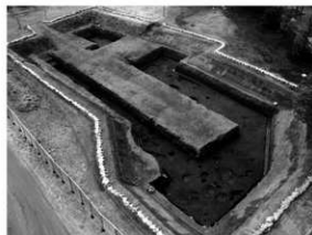
写真 1 遺構完掘状況 (北東より)

まとめ 今回の調査により弥生時代前期中葉から後期末にかけての集落関連遺構を検出した。これは、今まで調査地周辺には遺跡が確認されておらず、周辺に集落の存在を示唆するものである。近年の発掘調査により重信川下流域右岸で弥生時代から中世にかけての集落跡が確認されており、余戸弘川遺跡のやや上流にある当地においても継続的に集落を形成していたことが考えられる。この集落は遺構の密度や地形などから範囲はさらに北側へ広がるものと想定され、沖積低地における集落構造を解明する上で貴重な資料となる。