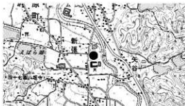
図 1 調査地位置図

概要 本調査は、愛媛県中予地方局が農地整備事業 (通作条件整備) 松山南部 3 期地区農道工事に伴い実施したもので、調査以前は水田として利用されており、現況の標高は、70.50～70.80 m である。