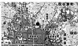
図 1 調査地位位置図

所在地 松山市祝谷二丁目 335 番 1、335 番 2 の各一部 (包蔵地 No.57) 期間 平成 27 年 11 月 16 日～平成 27 年 12 月 25 日 面積 約 151.22㎡ 原因 個人住宅建設 担当 小笠原善治