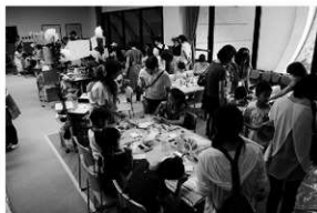
写真16 古代体験まつり