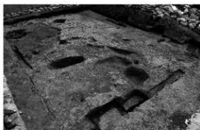
写真 1 遺構検出状況 (北西より)

まとめ 調査の結果、遺構が検出されたのは調査対象部分の南端であり、これより北部では検出されなかったため遺構が存在するのは南部方向と考えられる。また、今回検出された 5 基の柱穴は平面形態、規模、埋土、遺物の出土状況が似ており、掘立柱建物跡を構成するもので、柱穴には切り合いが見られるため、建物の建て替えが想定されるものである。また柱穴埋土から出土した弥生土器片から、調査地が削平を受ける以前は、弥生時代の包含層もしくは遺構等の存在が考えられる。