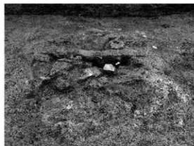
写真 2 土坑内遺物出土状況（北より）