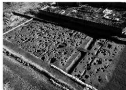
写真 2 調査区全景 (南西より)