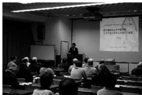
写真9 講演会「特別展 あつまれ！古代のかお」