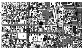
図 1 調査地位置図

所在地 松山市南江戸二丁目 681 番 1、681 番 2、 681 番・682 番合併 3、681 番・682 番合併 4、 681 番・682 番合併 5 の一部（包蔵地 No.37） 期間 平成 27 年 9 月 7 日～平成 27 年 10 月 8 日 面積 140.06㎡ 原因 緊急調査 担当 河野史知