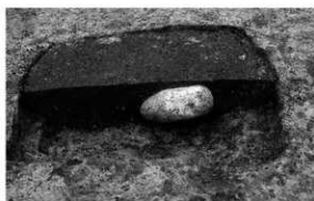
写真1 検出した弥生時代の土坑 (西より)

まとめ 弥生時代の遺構は、海拔 71.60 m より高い位置で検出された。このことは古市遺跡 2 次調査と同様であり、調査地より北東方向に展開すると予想される弥生時代前期末～中期初頭の集落の南西端が確認できたと思われる。古墳時代では、掘立柱建物跡及び土坑を検出し、集落の一部が確認できた。