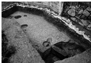
写真 1 1 区完掘状況 (南東より)

まとめ 今回の調査により土居窪遺跡周辺には弥生時代～古代にかけての集落関連遺構が存在する事が明らかとなった。特に今回は弥生時代中期から後期の集落関連施設の検出と B 区における大溝の検出および多量遺物の出土したことは、今まで周辺地域では調査事例の少ないことから、貴重な調査事例といえ、土居窪周辺における弥生時代の集落様相を解明する資料を得ることができたことは、大きな成果といえる。