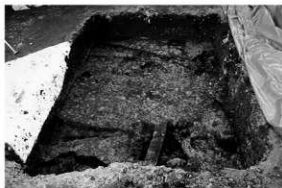
写真 1 1 区発掘状況 (北より)

近世 土坑 4 基を検出した。土坑は狭小な範囲の調査のため、形状や規模が不明瞭である。古墳時代の溝の用途、近世の土坑については、周辺の遺跡での関連を考えながら今後の課題としたい。