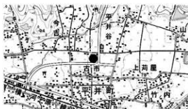
図1 調査地位位置図

概要 調査地は松山平野東部を西流する小野川と堀越川によって形成された扇状地上の標高 71 m に立地し、松山市埋蔵文化財包蔵地「No.90 菟屋遺跡群」内に位置する。調査地に接する松山市道「平井・水泥線」、「平井・食場線」新設工事による事前調査では弥生時代前期から古墳時代頃まで機能していた川幅 70 m を測る大規模な自然流路を検出した古市遺跡をはじめ、弥生時代前期末から中期初頭の土坑群、古墳時代の建物址等を検出した古市遺跡 2 次調査、五楽遺跡、上菟屋遺跡、下菟屋遺跡があり、集落関連遺構の存在が確認されている地域である。試掘調査では、弥生時代から古墳時代の土坑 2 基、柱穴 15 基が確認された。これらにより弥生時代から古墳時代の集落の範囲や性格の確認を主目的とし、開発工事により地下の遺構に影響する部分の調査を行った。検出した遺構は、土坑 7 基、柱穴 22 基である。遺物はこれらの遺構内外より弥生土器、須恵器、古代瓦、石製品が出土した。弥生時代の主な遺構は土坑 2 基、柱穴 6 基がある。土坑からは弥生土器の小片が少量と砂岩製の摺り石が出土した。古墳時代の主な遺構は土坑 5 基、柱穴 16 基がある。土坑では、遺構内より須恵器の破片、焼土、炭化物、拳大の円礫石が混在して出土したものや、断面形状が弥生時代の貯蔵穴に似た袋状を呈したものが検出された。