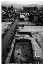
写真 2 3・4 区遺構検出状況 (西より)