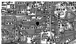
図 1 調査地位位置

概要 持田本村遺跡は、民間業者による分譲マンション建設事に伴い実施した埋蔵文化財の発掘調査である。調査地は、道後城北地区と呼ばれる松山市内でも有数の遺跡地帯東部にあたり、旧石手川の氾濫等により形成された扇状地上、標高約 36 m 前後に立地する。調査は 4 つの地区 (1～4 区) に分けて実施し、縄文時代から近世までの遺構や遺物を確認した。検出した遺構は、堅穴建物 6 棟 (古墳時代)、溝 6 条 (弥生時代: 1 条、古墳時代: 3 条、江戸時代: 2 条)、自然流路 1 条 (弥生時代)、土坑 16 基 (縄文時代: 7 基、弥生時代: 1 基、古墳時代: 8 基)、土坑墓 1 基 (弥生時代)、柱穴 27 基 (古墳時代以降) である。縄文時代の遺構は、落とし穴や貯蔵穴と思われる晩期後半の土坑を検出した。土坑内からは土器片や石器 (剥片) が多数出土しており、最終的にはゴミ捨て穴として利用されたものと推測される。弥生時代では、溝や自然流路のほか土坑と土坑墓を検出した。このうち、土坑墓からは木葉文が描かれた完形の小型壺 (前期後半) が出土した。古墳時代は遺構・遺物共に検出数が多く、堅穴建物は 5 世紀後半から 6 世紀後半の築造であり、古墳時代中期から後期にかけて集落が継続的に営まれていたことがわかる。なお、5 世紀後半の溝からは、口縁部の一部を故意に打ち欠いた土師器壺が出土している。古代から中世の遺構は未検出であるが、包含層中より奈良時代や平安時代に使用された土器片が少量出土した。江戸時代の遺構は、1・2 区にて真北方向を指向する最大幅 3.4 m、深さ 1.3 m の溝を検出した。溝からは江戸時代前期に使用された土師器や陶磁器が出土しており、の中には唐津焼の碗や皿などが含まれている。なお、これらの土器は破損品であるが、復元すると完形品になるものもあり、溝を廃棄する際に投棄されたものと考えられる。