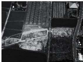
写真1 1区から3区全景写真（南より）

概要 本調査は、愛媛県中予地方局が農地整備事業（通作条件整備）松山南部3期地区農道工事に伴い実施したもので、調査以前は水田として利用されており、現況の標高は、70.50～70.80mである。調査は4区画（1～4区）に区分して実地され、遺構は竪穴建物5棟、掘立柱建物2棟、溝8条、土坑33基、古墳1基、柱穴86基を検出し、遺物は弥生土器や土師器、須恵器、石器、白玉が出土した。本調査では、弥生時代から近現代までの遺構や遺物を確認した。弥生時代では、2区検出のSB201は推定直径6mの円形建物で、弥生時代後期初頭から前半の土器片が出土した。古墳時代では、1区検出のSB101は一辺6mの方形建物で、古墳時代中期後半、5世紀後半の土師器や須恵器が出土した。SB101内からは炭化物や焼土が比較的大量に検出され、火災を受けた消失住居と考えられる。3区では、2棟の竪穴建物を検出した。SB301は一辺6.3mの方形建物で、古墳時代後期中葉（6世紀中葉）の土器が出土し、SB302は一辺6.1mの方形建物で、古墳時代後期前半（6世紀前半）の土器が出土した。SB101とSB301は造り付けのカマドが残存しており、当時の厨房施設の状況が知れる貴重な資料といえる。4区では、古墳1基を検出した。遺存状況が悪く、古墳の形状や規模等は不明であるが、埋葬施設は横穴式石室である。調査では支室の一部を検出し、開口方向や外郭施設等は定かではない。石室内からは遺物の出土はなく、石室周辺に残存する墳丘構築に伴う盛土の一部からは古墳時代後期後半から末に時期比定される土器が出土し、確実に存在していた古墳と考えられる。調査地内には弥生時代中期から後期、古墳時代中期から後期にかけて、確実に集落が営まれていたが判明した。 まとめ 今回の調査成果は、恵原町一帯を含む松山平野南部地域における弥生時代や古墳時代の集落様相や変遷を解明するうえで貴重な資料といえる。