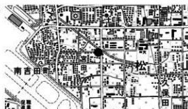
図 1 調査地位位置

所在地 松山市南吉田町 1021 番 1 の一部、1020 番 4 (包蔵地外) 期 間 平成 28 年 1 月 25 日～平成 28 年 1 月 26 日 原 因 保存整備 担 当 相原浩二