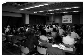
写真8 講演会「発掘へんろ」