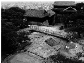
写真1 調査区及び乾門東続槽・乾門・乾槽(北東より)

なお、基盤層(地山)の地質である砂岩、礫岩及び花崗閃緑岩のうち、礫岩と砂岩の境界を確認した。まとめ 今回の調査では、本丸の構築方法に関わる重要な遺構を確認した。そのため、地下ポンプ室及び水槽の設置位置を変更し、同遺構を保存した上で工事を実施することとした。(西村)