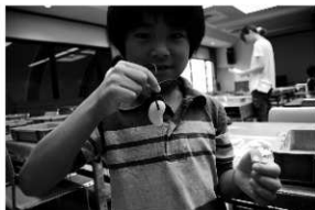
写真14 石勾玉を作ろう①