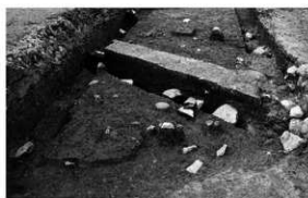
写真2 検出した古墳時代の土坑 (東より)