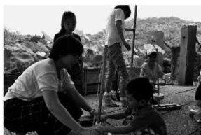
写真 19 火おこし体験