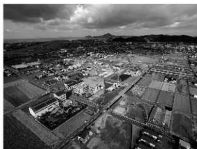
写真1 調査地全景（南東より）

まとめ 今回の調査では、室町時代の水田址を検出した。余戸柳井田遺跡 1 次調査においても同時期の水田址を検出しており、調査地周辺域には該期の水田が広範囲に展開しているものと考えられる。