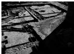
写真2 2区完掘状況（北西より）