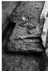
写真2 土坑墓検出状況（南より）