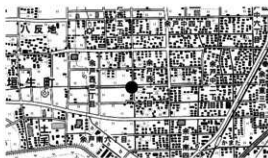
図 1 調査地位位置図

所在地 松山市余戸西三丁目 2484 番 6、2484 番 7、 2493 番 4、2485 番 4、2486 番 4 (包蔵地外) 期間 平成 28 年 1 月 5 日～平成 28 年 2 月 29 日 面積 約 803m 2 原因 緊急調査 担当 河野史知