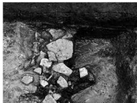
写真 2 SD6 遺物出土状況 (南より)