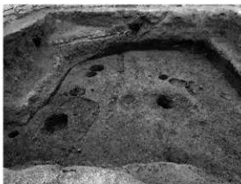
写真 1 遺構発掘状況 (東より)

まとめ 今回の調査で検出した遺構は、1 次調査 3b 区の集落構造を補足する貴重な資料である。