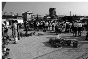
写真 22 出前考古学教室 1,000回達成（味酒小学校）