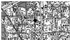
図 1 調査地位置図

概 要 調査地は石手川中流域南岸の微高地上、標高 40.0～40.3 m に位置する。調査地周辺では枝松遺跡として 11 回の調査が行われており、弥生時代では、枝松遺跡 6 次・8 次調査から土坑、枝松遺跡 3 次・5 次・8 次・11 次調査からは竪穴建物、枝松遺跡 5 次・8 次調査からは円形周溝状遺構、枝松遺跡 8 次・10 次調査からは溝を検出している。古墳時代では、枝松遺跡 7 次調査において溝と土坑 2 基を検出している。中世では、枝松遺跡 4 次調査から土坑 1 基を検出し、土坑内からは松山平野では検出例の少ないほぼ完形品の茶釜が出土し、枝松遺跡 7 次・9 次・11 次調査からも土坑や柱穴を検出している。本調査では、弥生時代と近世の遺構と、弥生時代から近世までの遺物を確認した。検出した遺構は溝 2 条、土坑 2 基、柱穴 6 基である。弥生時代の遺構は土坑 2 基を検出した。SK1・2 の平面形態は楕円形で、時期は弥生時代後期後半から末に時期比定される。SK1 の規模は長径 0.60 m、短径 0.55 m、深さ 19cm、SK2 は長径 1.25 m、短径 0.54 m 以上、深さ 16cm を測る。また、近世の遺構は溝 2 条を検出した。SD1 は東西方向の溝で、規模は幅 30cm、深さ 7cm を測る。溝からは近世、江戸時代に時期比定される土師器片や瓦が出土した。