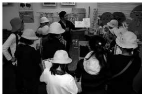
写真 21 団体来館（館内案内）