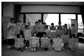
写真 18 染物体験（茜染め）