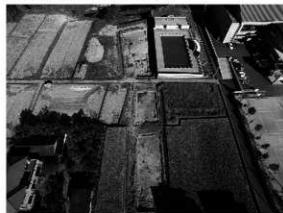
写真 1 6～8 区調査地全景 (西より)

まとめ 調査地内には弥生時代中期後半期から終末、古墳時代後期から末、古代にかけて確実に集落が営まれていたことが判明した。