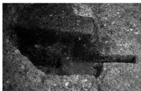
写真 2 柱穴半截状況 (東より)