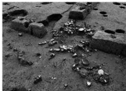
写真 1 土器溜まり 1 (北西より)

これら検出した遺構より、古墳時代と中世の集落が大峰ヶ台丘陵の南側から本調査地がある南江戸の東側まで大きく広がるのが判明した。今後、更に周辺の詳細な調査を続け、古墳時代と中世における集落の様相や構造等について解明していく予定である。