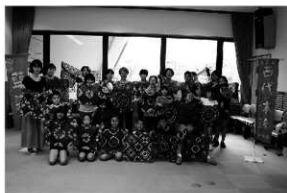
写真 17 染物体験（藍染め）