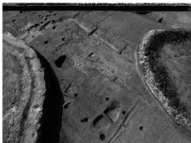
写真 1 D 区遺構掘削状況 (北より)

まとめ 今回の調査により中世集落を検出したことは、余戸中の孝遺跡 1 次～3 次調査から約 270 m 西北にも集落が広がることを示すものであり、沖積低地における集落構造を解明する上で貴重な資料である。