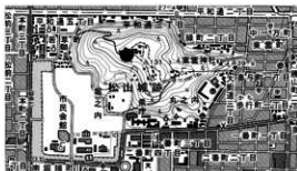
図1 調査地位位置図

概要 本調査は、松山城本丸防災設備等整備事業に係る確認調査である。調査は、本丸跡の北部、乾門東続槽の北東において防災用の地下ポンプ室及び水槽の埋設範囲を対象として実施した。調査の結果、江戸時代の整地土、切土斜面及び盛土、柱穴1基並びに小穴13基を確認した。