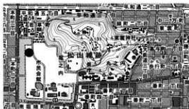
図 1 調査地位位置図

概要 国史跡「松山城跡」は、松山平野北部の独立丘陵、勝山を中心に構築された近世城郭である。松山市では「城山公園（堀之内地区）整備計画」を基に城山公園堀之内地区の整備を進めており、基礎資料の取得と遺構の保護を目的に平成 13 年度から確認調査を実施している。今回の調査では、北御門広場南端を区画する東西溝の西端と南北溝、馬場土手、南北方向道路、土層基礎を確認した。東西溝は、三之丸御殿側の東端と同じ規模を維持したまま西端まで延びていた。溝内からは多量の陶磁器類に混じり炭化物が出土していることから、三之丸御殿焼失後、当地周辺まで掻き出し埋めた可能性をもつ。溝内から出土した遺物は、御殿側の 17 次調査では焼土に混じって多量の瓦が出土しており、陶磁器類は少量であるのに対し、18 次調査の東西溝西端付近は、瓦よりも多量の陶磁器類が出土した。これらのことから、焼失した三之丸御殿の瓦など重いものを近くに埋めて、食器や貯蔵容器などの小物類が当地周辺に埋められたことが考えられる。南北溝は、東西溝に接続しているが、絵図によると元禄時代から文久時代の間は両溝の交差点が T 字状を呈しており、両溝が埋められる以前に南北溝の北側を石で塞ぎ、L 字状を呈していたことが分かった。馬場土手は、馬場端に黄色粘土を断面半円形状に盛り上げた構造である。南北方向道路は、固く締まっており、その東端の土層基礎は、外側に平らな面を呈した角石が並べられていた。