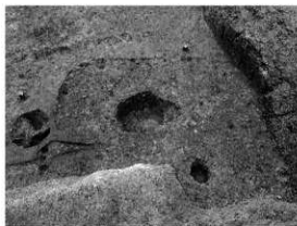
写真 2 竪穴建物の発掘状況 (南より)