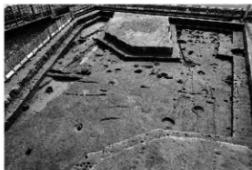
写真1 遺構検出状況（北より）

まとめ 今回の調査では、調査地や周辺地域には平安時代から鎌倉時代にかけて集落に関連する何らかの施設が存在し、その後、室町時代には水田や畑などを営むようになったものと考えられる。今後は整理・研究を進め、水田の形状や規模、範囲などを解明し、当時の水田を復元する必要がある。