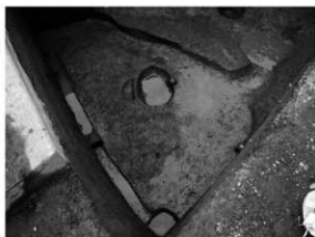
写真 1 SB1 検出状況（南西より）

まとめ これまでの調査では工事対象地である松山市余戸地区において、古代から中世、平安時代後期から室町時代において、広範囲に遺跡の存在が証明されている。狭小範囲の調査であったため竪穴建物や溝の全容は定かでないが、今回の調査により調査地や周辺地域における古墳時代集落の存在が確実視されることになった。このことは、松山市余戸地区における集落様相や変遷を解明するうえで重要な成果といえよう。