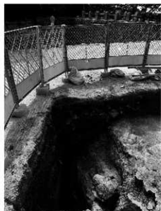
写真2 切土斜面及び盛土、柱穴(東より)