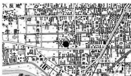
図 1 調査位置図

所在地 松山市余戸西一丁目 1981 番 1、1982 番 3、 1983 番 1、1983 番 6 の各一部 余戸西二丁目 2331 番 5・6 (包蔵地外) 期間 平成 28 年 1 月 5 日～平成 28 年 2 月 29 日 面積 約 250㎡ 原因 緊急調査 担当 宮内慎一