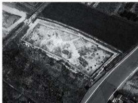
写真2 3区完掘状況（南東より）