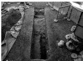
写真1 1区南部完掘状況（南より）

まとめ 今回の調査では、1区、2区において近世の遺構を確認することができた。1区で検出された溝は、トレンチの為僅かな長さの調査であり、溝の性格等については明確にできなかったが、溝の方向については、松山城本丸跡6次調査で確認された池跡方向を指していると考ええる。2区で検出した柱穴群の埋土からは天守基壇石垣に使用している花崗岩の碎片が出土していることや、深さ68～101cmの規模の柱穴（6基）は、柱間が24m、3mの2種類の間隔を測るが、東西、南北方向に一直線上に並んでおり、ほぼ天守基壇石垣と並行していることなどから、石垣構築時には機能していたものと考えられるが想像の域は越えない。3区において遺構は検出されなかった。絵図を確認してもこの位置する部分には建物等は描きこまれていない。遺構が検出されなかったことも一つの成果となった。