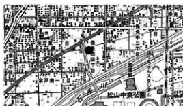
図 1 調査地位置図

概 要 調査地は、松山平野西側の石手川と重信川の合流点に近く、現在の重信川河口から約 4km 上流の右岸に立地する。調査地周辺は旧重信川の氾濫原と考えられ、標高約 10 m を測る。調査以前は中学校のグラウンドとして利用されていた。調査地周辺では、西約 900 m に余戸弘川遺跡があり、弥生時代後期の墓域と中世の集落が見つかり、多数の遺物が出土している。今回の調査において、弥生時代前期から後期末の溝 4 条、自然流路 1 条、土坑 15 基、柱穴 42 基などを検出した。溝は調査区の地形がやや低い南側に集中して東西方向に延びており、自然流路は地形の低い南端を東西方向に延びている。溝 SD1 は、上場幅 50cm、深さ 20cm 程の小規模な溝であるが、埋土上位から溝床にかけて弥生土器に混じり、緑色片岩の未成品が多数出土したことは、集落内で石器製作が行われていた可能性が考えられる。また、SD2 からは砂礫に混じり弥生時代前期から後期末までの土器片が多数出土しており、自然流路から北側の地形がやや高い部分に継続的に集落が形成されたことが窺える。土坑は地形のやや高い北側に集中しており、長軸が約 1m と約 2m の規模のものが検出されている。SK11 は円形を呈しており、規模や形状から小型の堅穴建物も考えられるが、建物を構成する痕跡は未検出であった。