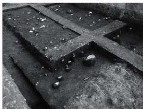
写真1 SR1 遺物出土状況 (南西より)

まとめ 今回の調査により古墳時代後半から中世にかけての集落関連遺構を検出したことは、今まで調査地周辺で行われた、平井遺跡の関連調査の結果を追認する事となった。また、小野・平井地区における弥生時代から中近世までの集落様相を解明する、貴重な調査成果を得る事が出来た。