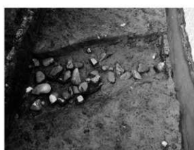
写真 2 溝内から出土した礫 (南より)