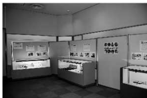
写真1 「考古館・楽しかった2014展」