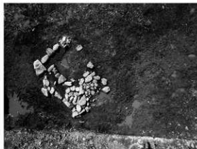
写真 2 2 号墳発掘状況 (北より)