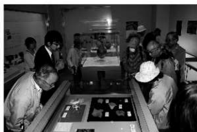
写真4 展示会「いにしへのえひめ」