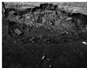
写真2 SD1 検出状況（東より）