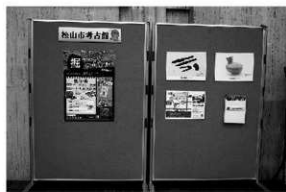
写真7 「松山市考古館写真展」(松山市役所ロビー)