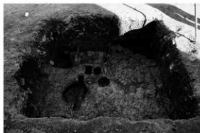
写真 2 2 区発掘状況 (西より)