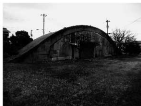
写真 1 航空機有蓋掩体全景 (南西より)

まとめ 調査の結果、掩体内部のトレンチでは、深さ 6～8cm で当時の地表面と考えられる固く締まった層を検出したが、掩体の外部トレンチでは、人工的に敷き詰められた層や固くしまった層は検出しなかった。このことから、掩体周辺では現代の耕作などによって当時の地表面はほぼ消失しているものと考えられた。