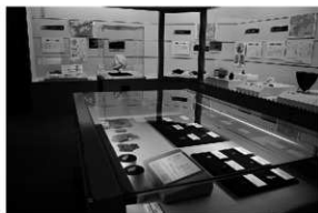
写真2 発掘へんろ展「四国の黎明」