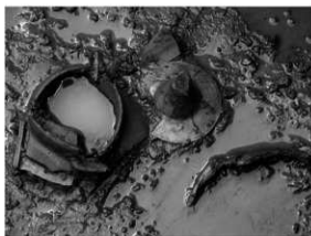
写真 2 SB1 遺物出土状況（南より）