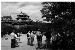
写真12 「わかりやすい考古学講座」(10月)