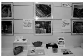
写真3 展示会「掘ったぞな松山2015」