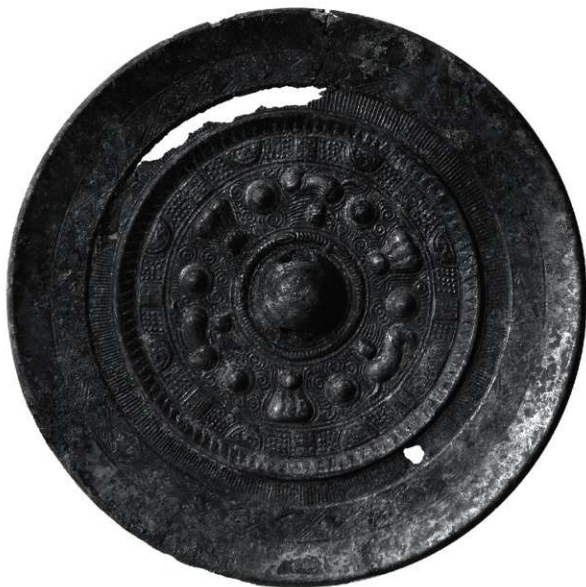
写真1 寄贈青銅鏡（保存処理後）