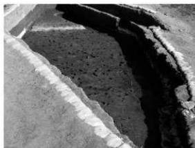
写真2 足跡検出状況（南より）