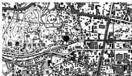
図 1 調査地位置図

概要 調査地は、松山平野の西部、衣山の低位丘陵の標高約 19 m に立地し、松山市埋蔵文化財包蔵地「No.20 永塚古墳」内に位置する。周辺の遺跡としては、申請地の北側に前方後円墳である永塚古墳、衣山大塚北遺跡、衣山北組遺跡があり、西側には衣山西ノ岡遺跡のほか古代の窯跡の存在が確認されている。このうち調査地に近接する衣山大塚北遺跡では、弥生時代後期の竪穴建物や古墳時代の溝や土坑などが見つかり、付近一帯には弥生時代～古墳時代にかけての集落が広がっている事が確認されている。試掘調査では柱穴 4 基を検出し、遺物は弥生土器と考えられる土器片が出土した。これらの事により、弥生時代以降の集落の範囲や性格の確認を主目的として調査を行った。調査地は緩斜面上に立地しているため、標高の高い部分は切土が行われ削平されていた。また以前の建物による攪乱も受けていたが、調査の結果、柱穴 5 基を検出した。