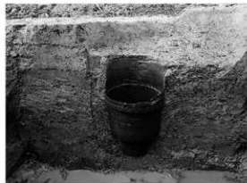
写真 2 井戸半截状況 (南より)