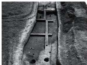
写真2 SR1 完掘状況 (北より)