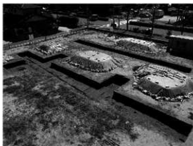
写真 1 調査地全景（北西より）

まとめ 南江戸地区は、県下でも有数の中世村落の構造が復元できる遺跡が数多くあり、今回の調査において、その村落がさらに南東域に広がることが確認出来た。今後は、検出した遺構と周辺遺跡との関連を明確にすることが整理する上での課題である。