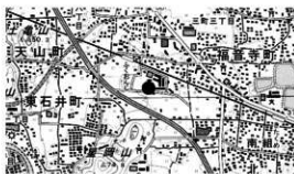
図 1 調査位置図

概要 調査地は、松山平野の中央部に位置し、川附川や小野川、堀越川などの大小河川に挟まれた微高地上の標高約 31 m に立地する。周辺では福音小学校構内遺跡や筋違 A～O 遺跡、乃万の裏遺跡など数多くの発掘調査が実施されており、弥生時代から古墳時代を主体とする集落の存在が明らかになりつつある。特に福音小学校構内遺跡 1 次調査では、弥生時代、古墳時代の竪穴建物や掘立柱建物・溝・土坑などで構成される大規模集落跡を確認している。今回の調査範囲は狭小ではあるが、弥生時代から古墳時代の遺構や遺物を確認した。遺構は、竪穴建物址 1 棟、溝 1 条、柱穴 9 基、性格不明遺構 1 基である。遺物は弥生土器、土師器、須恵器、陶磁器、石製品が出土した。調査区に隣接する 1 次調査 3b 区は竪穴建物や掘立柱建物が高密度で展開しているが、北東方向に隣接する 1 次調査 2a 区の西端部や北西方向に隣接する 1 次調査 2b 区では遺構が低密度であり、集落構造を考える上で重要な場所である。弥生時代の竪穴建物は西北角部だけの検出であり、全容は不明であるが、隅丸方形の 4 本柱構造であることが推測できる。また、建物の床面は、礫が混じっており凹凸があるが、平坦にするために貼り床としている。この建物の南側は 1 次調査 3b 区に延びており、位置関係から SB106 の西北角部である可能性が高い。古墳時代の溝 SD1 は東西方向を指向しており、さらに西側は調査区外へ延びる様相を呈した小溝である。柱穴 SP1・2・4 は規模や埋土がほぼ同一であり、調査区外に展開する掘立柱建物の一部と考えられる。1 次調査 3b 区に密集する掘立柱建物群がさらに北側に展開していく様相を示すものである。SX1 は現代坑に切られ全容は不明であるが、残存形状から方形の周壁溝を伴う竪穴建物の南西角部の可能性がある。