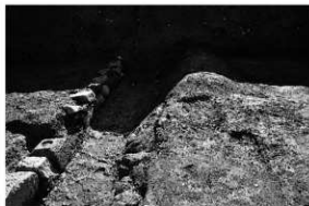
写真 2 馬場土手と並行する南北溝（北より）