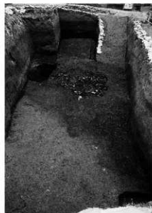
写真 2 SR1 遺物出土状況 (西より)