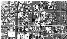
図 1 調査地位置図

概要 調査は、松山駅周辺土地区画整理事業 (駅西地区) に伴う埋蔵文化財発掘調査である。