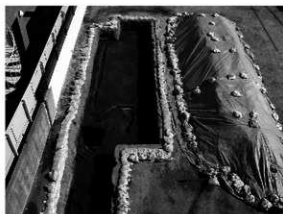
写真 1 完掘状況 (西より)

まとめ 今回の調査では、弥生時代と近世の遺構と弥生時代から近世までの遺物を確認した。本調査における土坑の検出は、調査地周辺に展開する弥生後期集落の広がりを知るうえで、貴重な資料といえよう。近世の遺構は溝 2 条を検出した。本調査検出の 2 本の溝は、農耕に伴う鋤跡あるいは畝溝の可能性があり、調査地周辺には江戸時代において広範囲に水田や畑が営まれていたものと推測される。