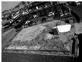
写真 1 完掘状況 (南より)

まとめ 今回の調査では、弥生時代の溝や土坑のほか、古墳時代の遺物を確認した。調査地東方に展開する弥生時代や古墳時代の集落域が、国道 11 号線以西にも広がっていることが判明した。さらに、古代や中世の遺構・遺物の検出は、該期間の集落が調査地近隣に存在することを物語る貴重な資料といえる。