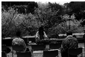
写真10 考古館ロビー 箏コンサート