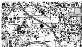
図 1 調査地位置図

期間 平成 28 年 2 月 22 日～平成 28 年 3 月 17 日 面積 約 85㎡ 原因 宅地造成 担当 水本完児