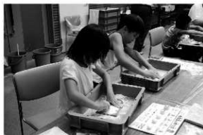
写真15 石勾玉を作ろう②