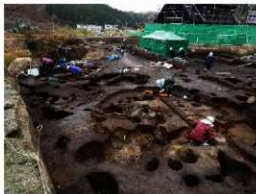
住居跡の調査風景