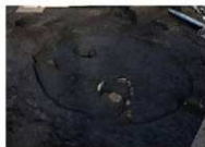
縄文時代中期中葉から後葉にかけての住居跡