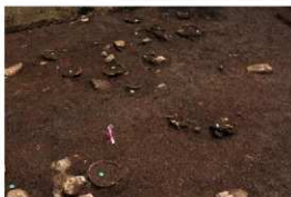
密集する土器埋設遺構