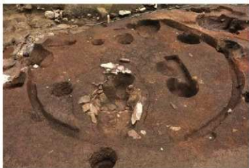
縄文時代中期末葉の住居跡