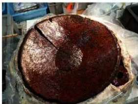
大型木胎漆器把手付浅鉢（直径約 46 cm）