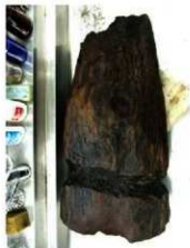
先端に溝が一巡する木柱