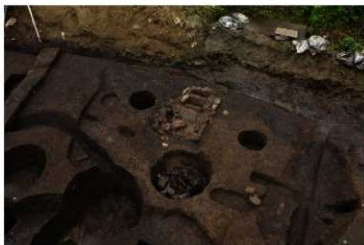
縄文時代中期後葉の住居跡

縄文時代中期末葉の住居跡は、調査区中央部から東端にかけて見つかっています。住居内には複式炉が造られています。この時期が、前田遺跡で最も集落が大きくなった時期と考えられます。