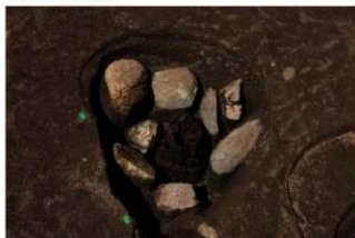
礫で柱の周囲を固めている柱穴