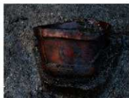
木胎漆器把手 （口径約 16 cm × 13 cm）