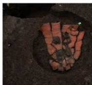
土器の中に子供骨が残る