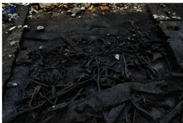
木製品が多く出土した

前田遺跡は、漆塗された容器や木製品(弓・斧柄・刈り払い具・発火具)、竹類で編まれたカゴなどの網み組み製品など、当時の生活痕跡が非常によく残っていました。また、クルミ・クリなどの種実類、獣骨、昆虫なども見つかり、縄文人の生業や食糧事情などの解明につながります。さらに当時の気候や植生などの環境復元も可能となるでしょう。