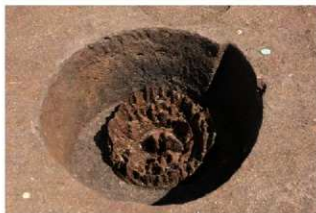
直径 60 cm を超える木柱