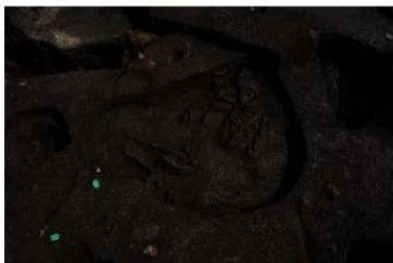
埋葬された縄文人（ほぼ全身が残る）

内陸部の遺跡で、縄文時代の人骨が見つかる例は非常に珍しく、出土人骨を詳細に研究することで、埋葬時の年齢や栄養状態、生活していた当時の前田遺跡の環境など、彼ら前田遺跡の人骨たちは、私たちに多くの情報を語ってくれることでしょう。