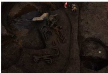
埋葬された縄文人（右手の一部が柱穴に壊されている）