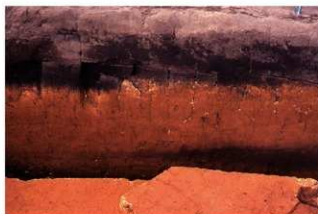
土層断面 (P 地点)