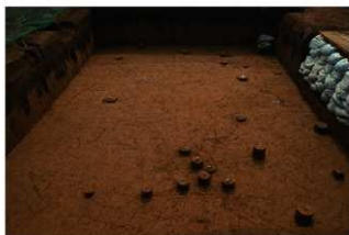
VII層 石器集中 6, 碟群 7 (F地点)