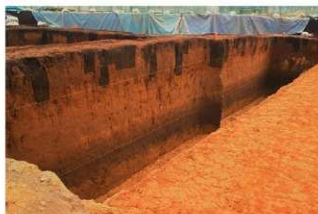
土層断面 (E 地点)