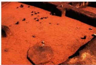
X層石器集中1, 2号土壌 (J地点)