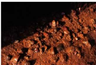
二次堆積層磔群 5 (P地点)