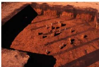
VII層 石器集中 9, 碟群 9 (M地点)