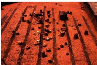
IV層上部石器集中11, 礫群19 (P地点)