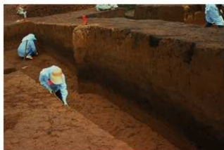
土層断面 (G 地点)