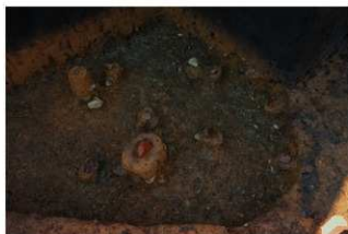
二次堆積層石器集中 4, 磔群 4 (G地点)