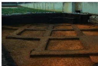
礎層面検出状況 (G 地点)