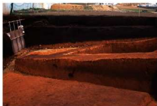
土層断面 (P 地点)