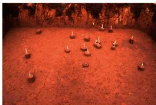
VII層 石器集中 1, 碟群 3 (R地点)