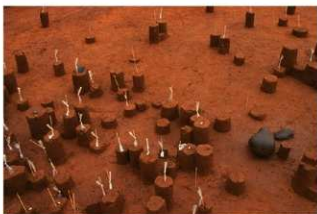
Ⅸ層石器集中 1 (J地点)