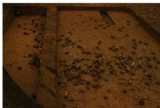
IV層上部石器集中10, 礫群18 (G地点)