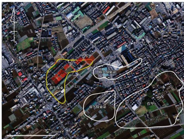
藤久保東遺跡周辺航空写真（2008年12月撮影 1/15,000）