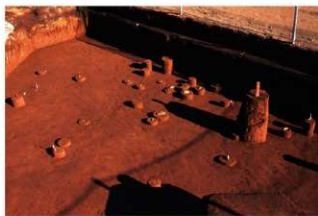
Ⅶ層石器集中 10, 磔群 11 (M地点)