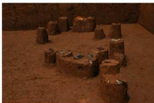
VII層 石器集中 4, 碟群 6 (F地点)