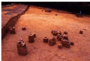
VII層 碟群 1 (P地点)