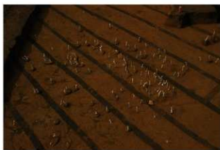
Ⅲ層石器集中 1, 礫群 1 (E 地点)