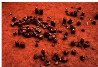
IV層下部 碟群 6 (S地点)