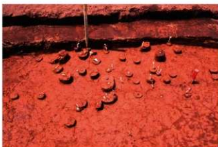
IV層下部石器集中3, 礫群2 (P地点)