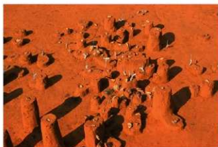
Ⅳ層上部石器集中 2, 礫群 1 (E 地点)