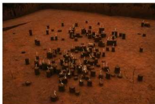
Ⅸ層石器集中 1 (J地点)