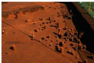
Ⅸ層石器集中 3・4・5・6 (J地点)