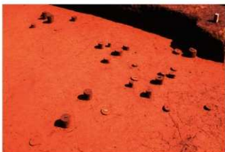
Ⅹ層石器集中 1 (J地点)