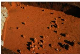
Ⅳ層上部石器集中 1・4, 礫群 2・3 (E 地点)