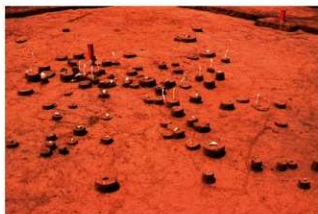
IV層下部石器集中2, 礫群1 (P地点)