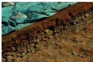
土層断面 (G 地点)