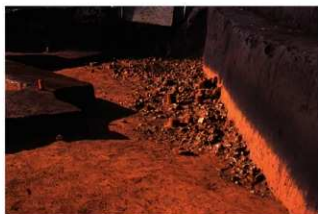
礎層面検出状況 (P 地点)