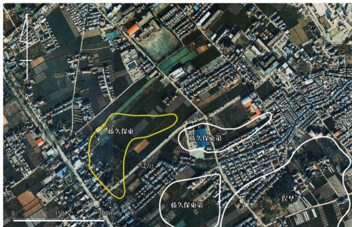
藤久保東遺跡周辺航空写真（1988年撮影 1/15,000）