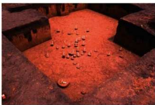
Ⅶ層石器集中 15, 磔群 15 (M地点)