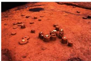
VI層 碟群 1 (P地点)