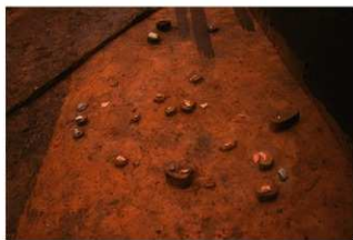
IV層上部石器集中9, 礫群14 (E地点)