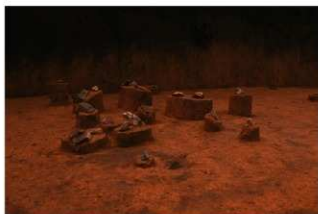
Ⅳ層上部礫群 10 (E 地点)