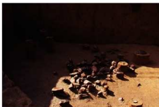
VII層 碟群 2 (P地点)