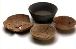
▲平城宮東方官衛出土 小型食器

奈良時代後半になると食器は小型のものが多くなります。現代の感染予防策と同じで大皿での盛り付けを避けたのかもかもしれません。