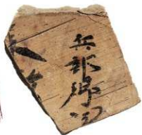
▲SD5300 出土 墨書土器

「兵部卿宅」と書かれた土器片。SD5300 には天然痘で亡くなった兵部卿 藤原麻呂の邸宅で使われていた遺物が含まれていました。