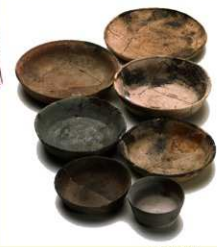
▲SD5100 出土 灯明皿

天平 10 年 (738) 頃の燃灯供養に用いられたもの。天然痘禍が長屋王の乗りとおそれた光明皇后が長屋王を鎮めるためにおこなったものかもしれません。