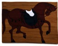
▲SD5300 出土 絵馬(複製)

いまの絵馬と少し異なり、祭りや祈りに使ったと考えられています。筆遣いが巧みで、馬の筋肉の動きや表情などをリアルに表現しています。