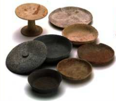
▲SD5300 に捨てられた食器

まだ使えるほぼ完全なかたちをとどめています。天然痘の感染を防止するために使い捨てられた可能性が高いと考えられます。