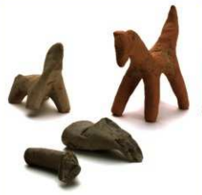
▲SD5100 出土 土馬

土で作った馬の焼きもの。病気をもたらす疫病神の乗り物で、疫病神が病気を広めないように、わざと脚を折って水に流したとも考えられています。