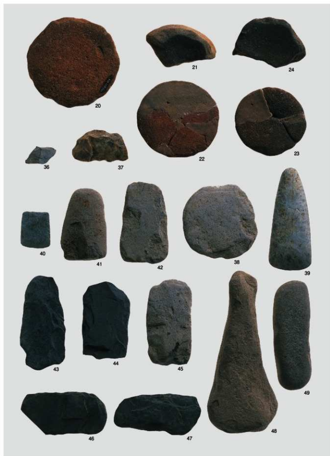
縄文時代 出土遺物2 (土器②・石器①)