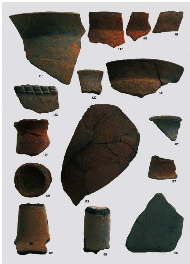
弥生~古墳時代 出土遺物4 (土坑2号)