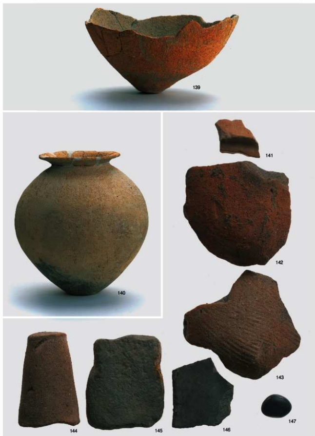
弥生～古墳時代 出土遺物6 (埋設土器1号・溝1号)