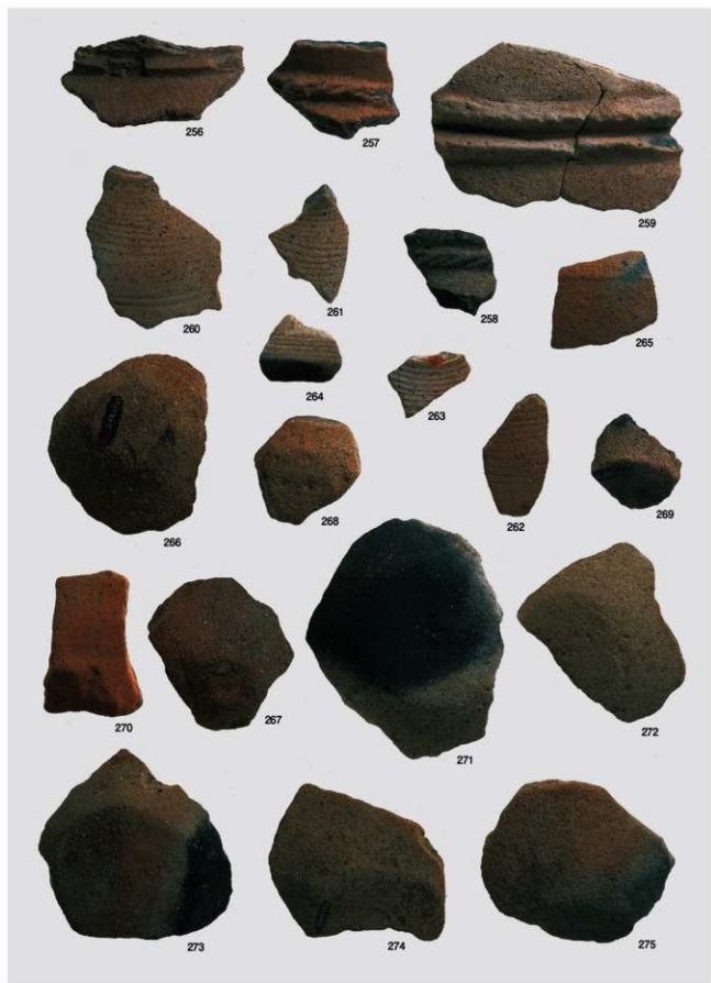
弥生~古墳時代 出土遺物12 (土器 壺③)