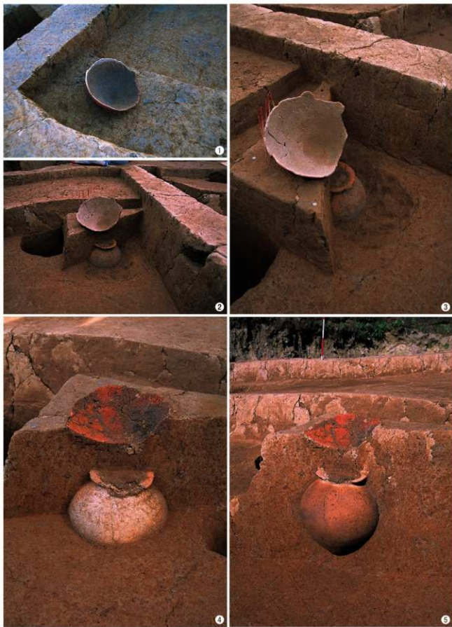
①検出1 (上部) ②検出2 (側面から) ③検出3 (上面から) ④半截1 (上半分) ⑤半截2 (全体)