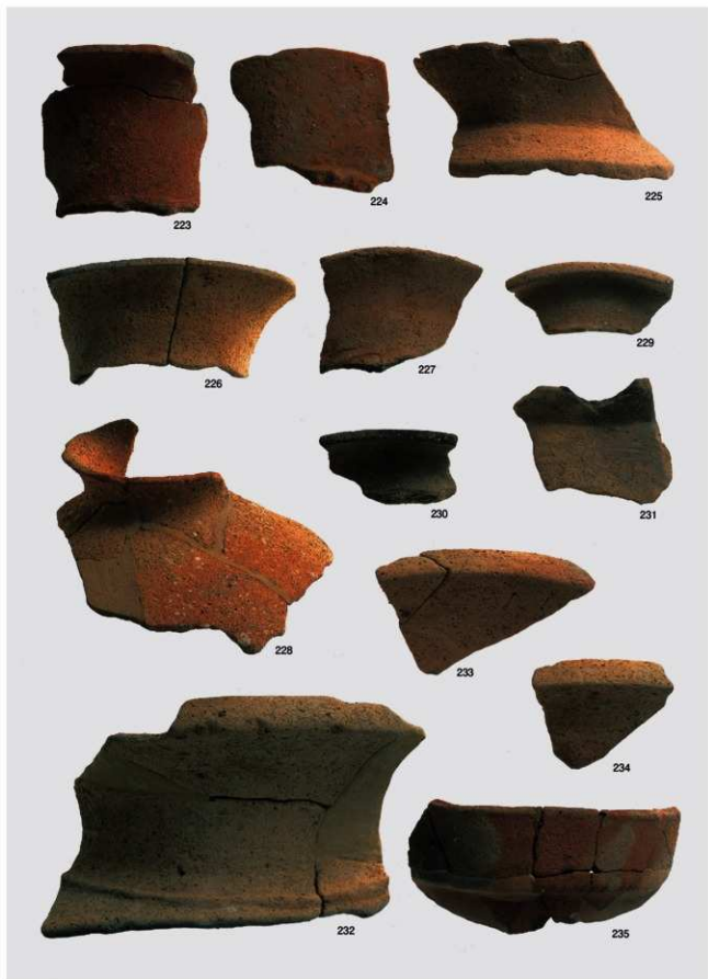
弥生～古墳時代 出土遺物10 (土器 壺①)