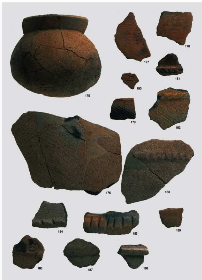
弥生～古墳時代 出土遺物8 (土器 甕②)