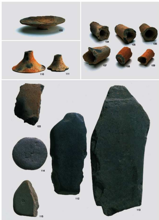
弥生～古墳時代 出土遺物3 (竪穴住居跡1号③)