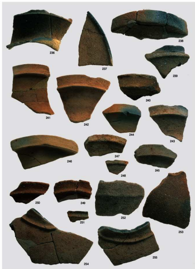
弥生～古墳時代 出土遺物11 (土器 壺②)