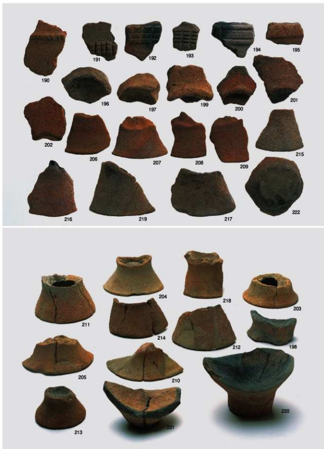
弥生～古墳時代 出土遺物9 (土器 甕③)