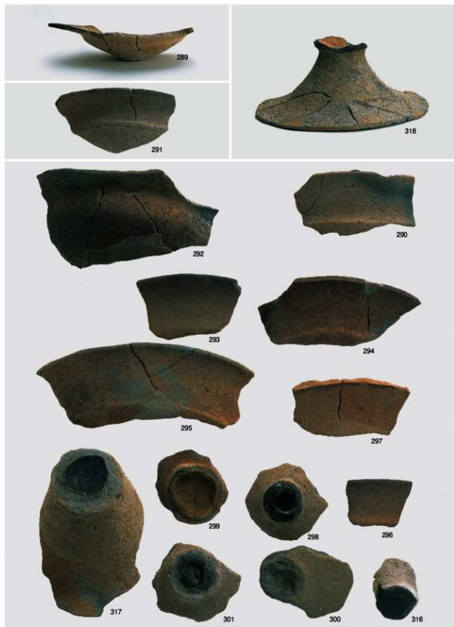
弥生～古墳時代 出土遺物14 (土器 高坏①)