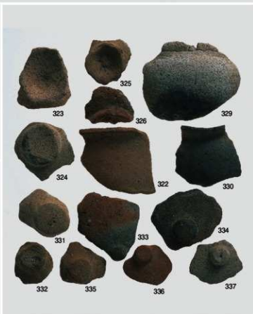
弥生～古墳時代 出土遺物15 (土器 高坏②・鉢ほか)