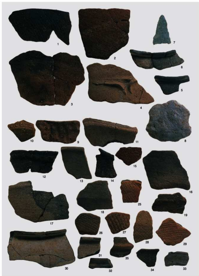
縄文時代 出土遺物 1 (土坑 1 号・土器①)