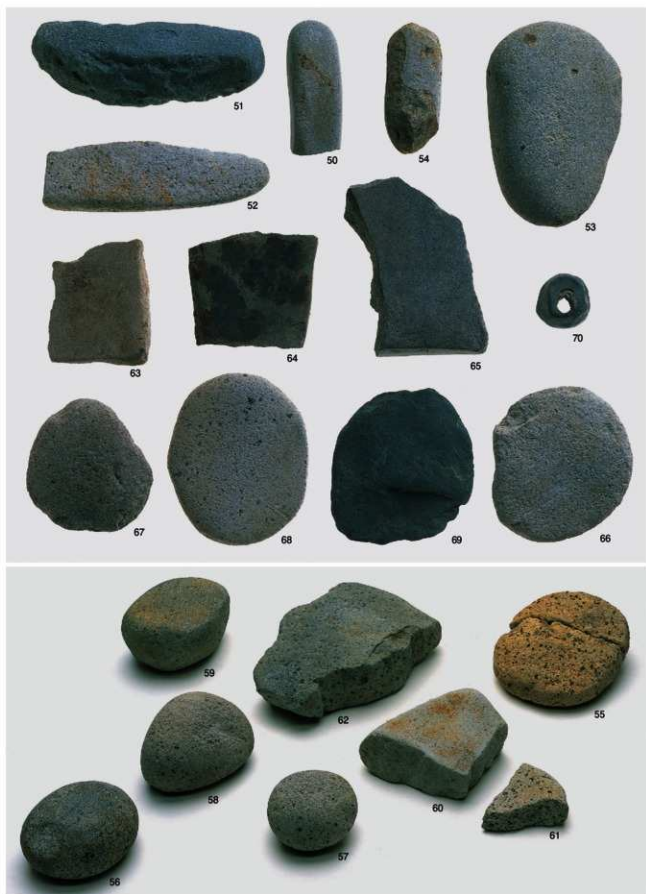
縄文時代 出土遺物3 (石器②)