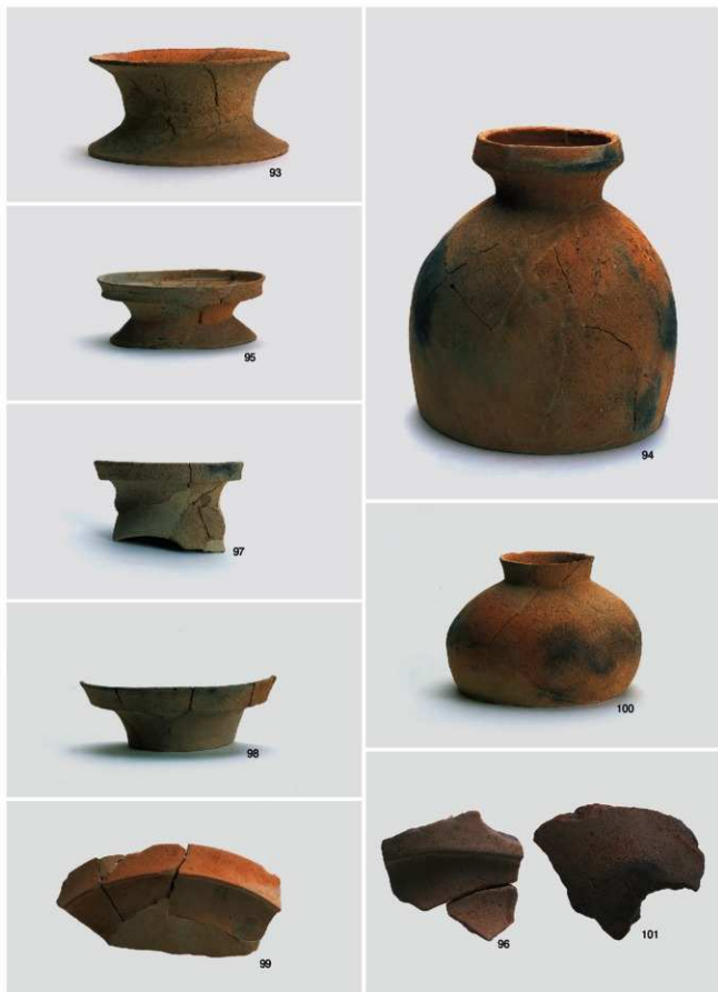
弥生～古墳時代 出土遺物2 (竪穴住居跡1号②)