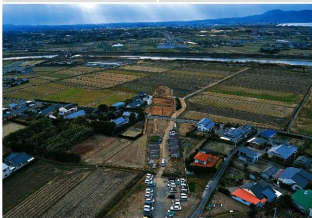
古代～近世 出土遺物（土坑5号・古銭ほか）・遺跡遠景（東方向から）