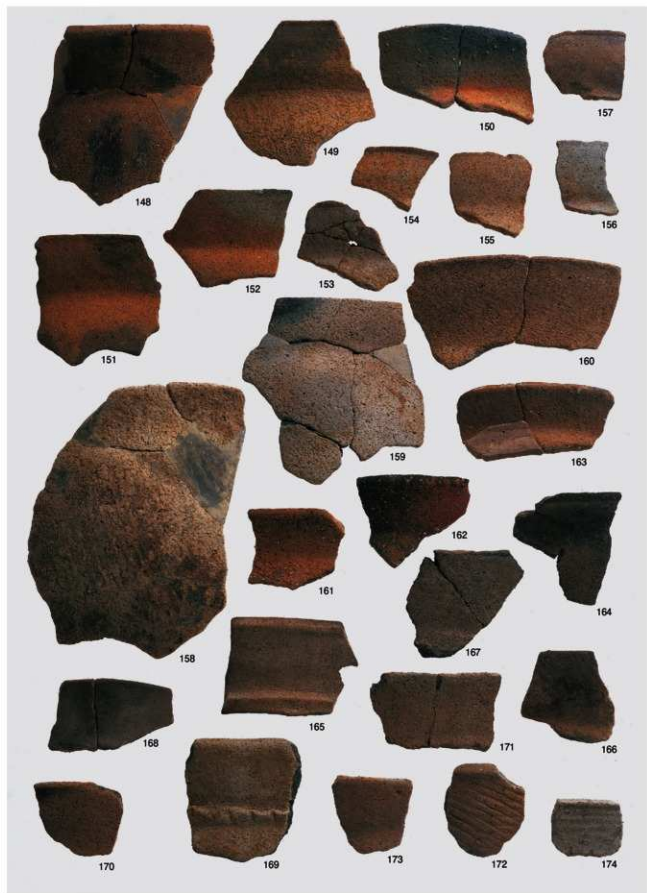
弥生～古墳時代 出土遺物7（土器 甕①）