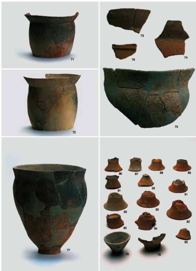
弥生～古墳時代 出土遺物 1 (竪穴住居跡 1号①)