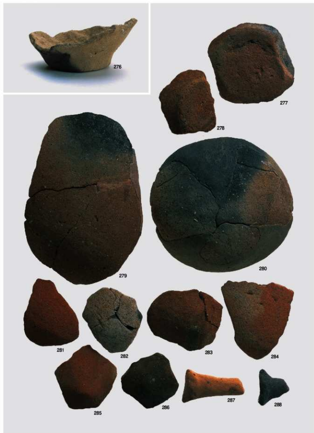
弥生～古墳時代 出土遺物13 (土器 壺④)