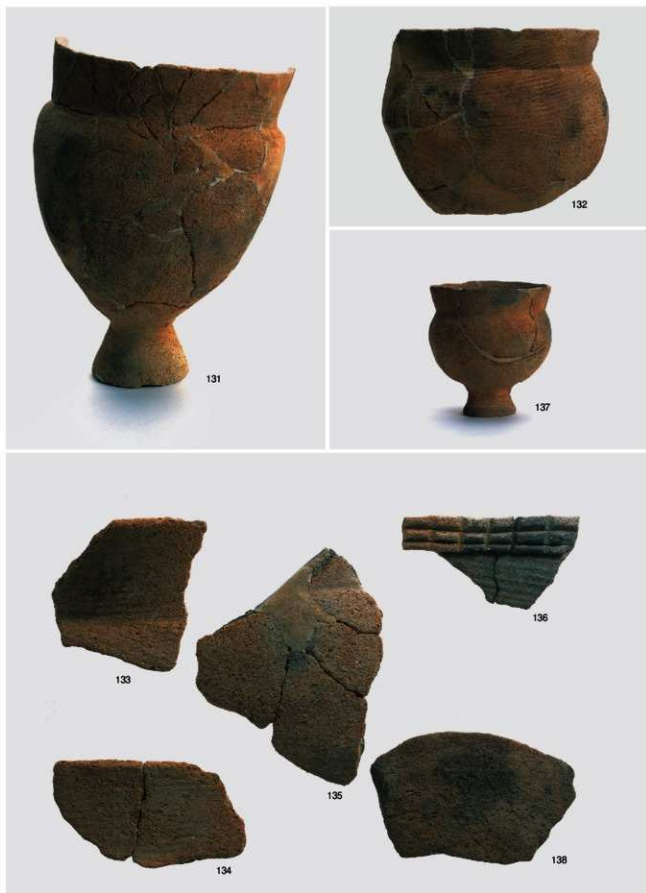
弥生～古墳時代 出土遺物5 (土坑4号)