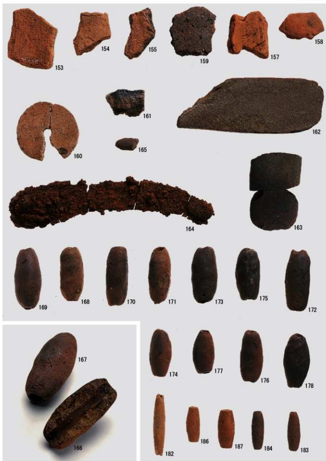
古代 I 期その他の遺物