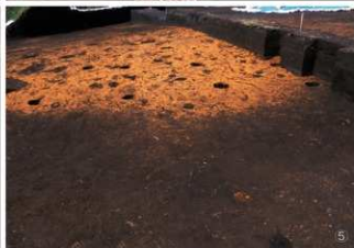
① 石塔・石碑（正面から） ② 石塔の台座 ③ 土坑11号検出状況 ④ 土坑11号 ⑤ 杭列