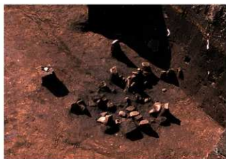
図版4 縄文時代早期の集石