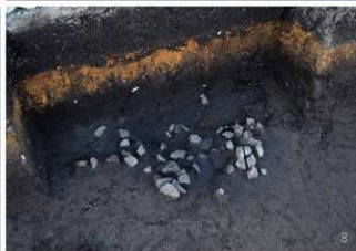
① 集石9号 ② 集石10号 ③ 集石11号 ④ 集石12号 ⑤ 集石13号 ⑥ 集石14号 ⑦ 集石15号 ⑧ 集石16号