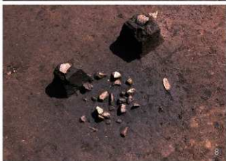
① 集石 1号 ② 集石 2号 ③ 集石 3号 ④ 集石 4号 ⑤ 集石 5号 ⑥ 集石 6号 ⑦ 集石 7号 ⑧ 集石 8号