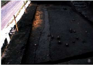
① 大型土坑 2号検出状況 ②・③ 大型土坑 2号埋土断面 ④ 大型土坑 2号 ⑤ 土坑 8号 ⑥ 土坑 9号半截 ⑦ 土坑 9号 ⑧ 硬化面検出状況