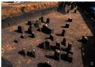
① 遺跡遠景（南から） ② 旧石器時代遺物出土状況 ③ 縄文時代早期遺物出土状況（G-5区付近） ④ 縄文時代早期集石検出状況（14～16号）