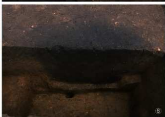
① 土坑1号 ② 土坑2号 ③ 土坑3号 ④ 土坑5号 ⑤ 土坑6号 ⑥ 土坑7号 ⑦ 落とし穴 ⑧ 落とし穴半截