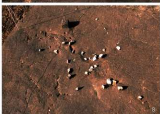
① 集石17号 ② 集石18号 ③ 集石19号 ④ 集石19号 掘り込み ⑤ 集石20号 ⑥ 集石22号 ⑦ 集石23号 ⑧ 集石24号