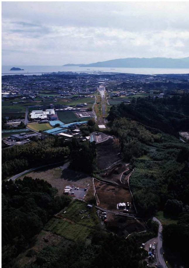
遺跡遠景（北から志布志湾を望む）