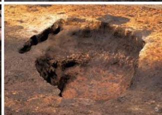
① 遺物等出土状況 ② 検出状況 ③ 埋土断面 ④ 石塔出土状況 ⑤ 完掘状況