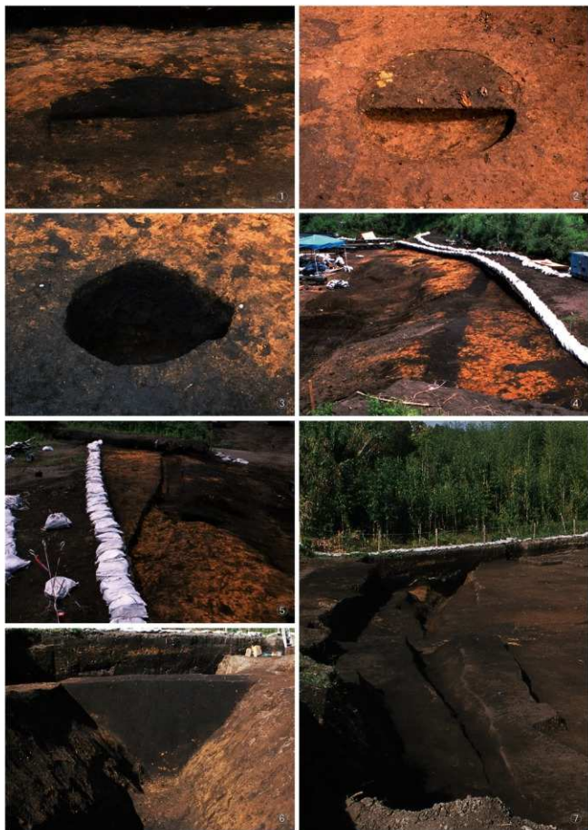
① 土坑10号 ② 土坑12号 ③ 土坑13号 ④ 溝状遺構5号検出状況 ⑤ 溝状遺構5号 ⑥ 溝状遺構6号埋土B断面 ⑦ 溝状遺構6号