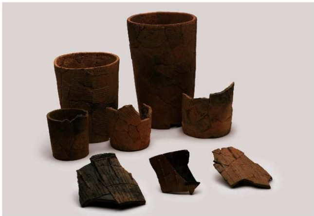
縄文時代早期の出土遺物