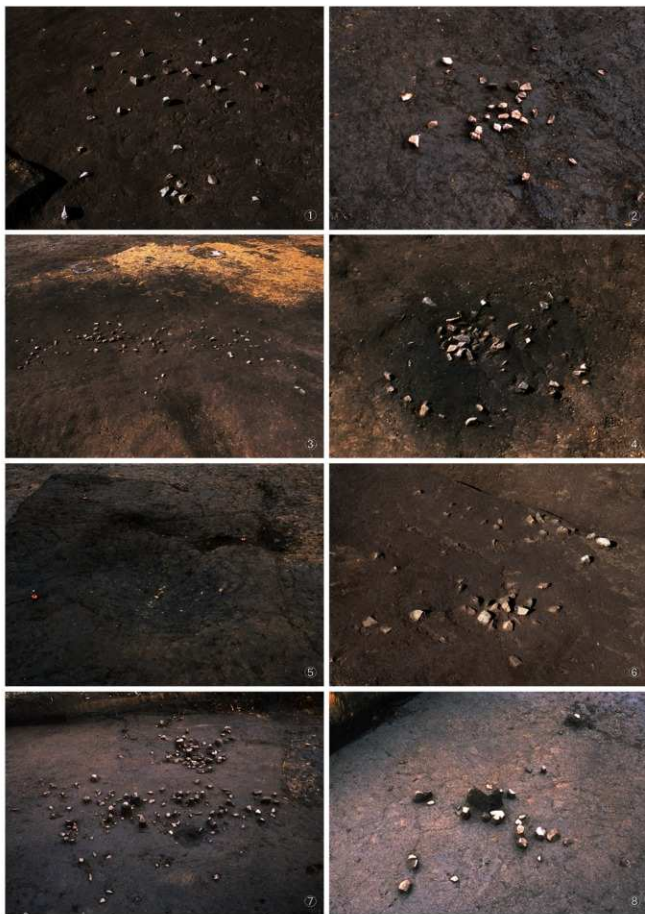
① 集石25号 ② 集石26号 ③ 集石27・28号 ④ 集石29号 ⑤ 集石29号掘り込み ⑥ 集石30号 ⑦ 集石31・32号 ⑧ 集石33号