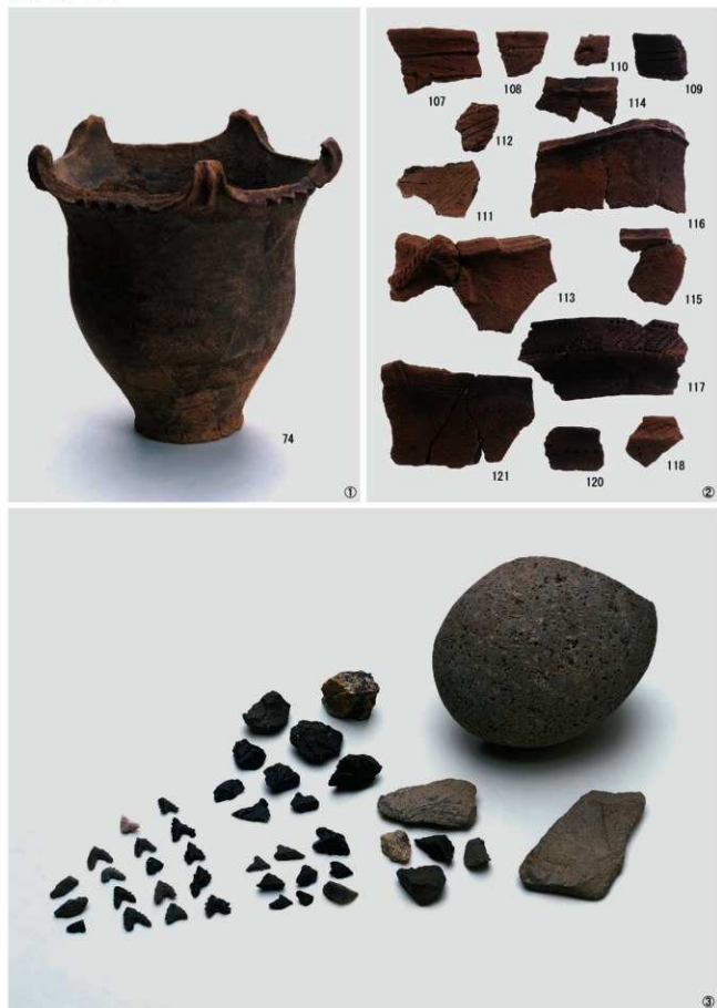
①縄文時代中期の土器 ②縄文時代後期の土器（Ⅵ・Ⅶ・Ⅷ類） ③石器製作跡出土石器