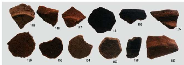
縄文時代後期の土器 (Ⅶ・Ⅸ・Ⅹ・Ⅺ類) 縄文時代晩期の土器