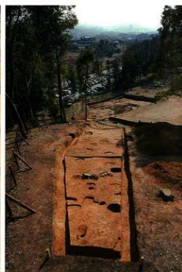
北東斜面調査区 (北から)