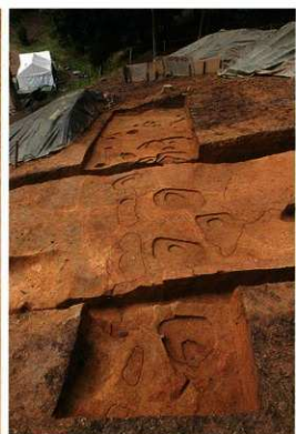
柱列1・柱列2 (東から)