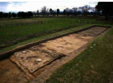
基幹排水路西方の南北棟基壇建物とその東側の礎石（北東から）