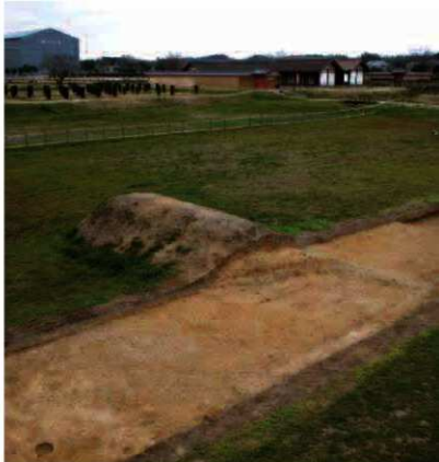
南北長が18.7m、高さが80cmを超える大型建物基壇（南東から）