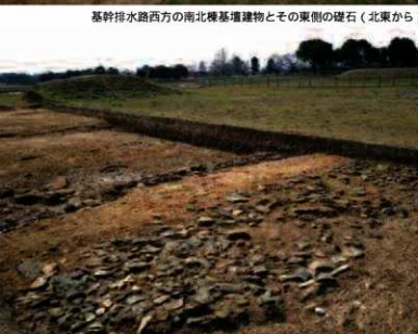
官衙区画の間仕切りとして機能した東西築地と落下瓦（北東から）

調査の成果 発掘調査の結果、基幹排水路の東側には、東西約45m、南北約120m以上の区画が存在し、少なくとも2時期の変遷があることが明らかになりました。また、この区画は、東西築地によって仕切られていたようです。区画内の北半には、梁行1間、桁行1間以上の掘立柱建物1棟、梁行2間、桁行1間以上の庇を付けた礎石建物1棟が確認され、区画内の南半には、礎石建ちと推定される大型基壇建物を中心とし、その南に、桁行10間以上の南北に長い基壇建物を東と西に配置していたことがわかりました。