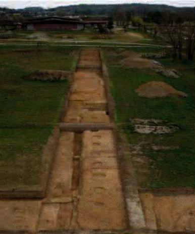
桁行10間以上の長大な南北棟基壇建物（南から）