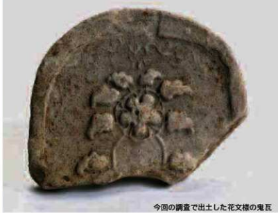
今回の調査で出土した花文様の礎石