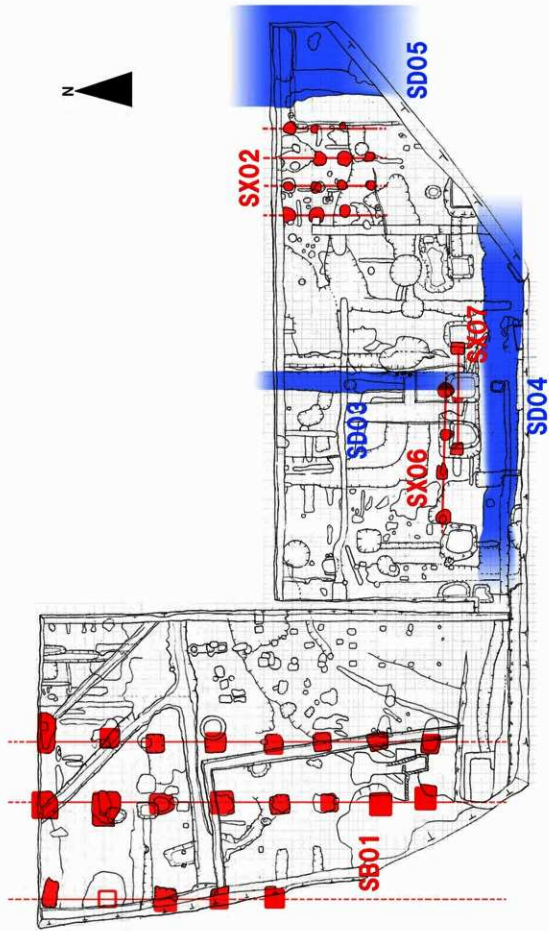
平城第 404 次調査 透視平面図 1:200