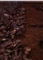
遺構の石の瓦礫層 (図中5)