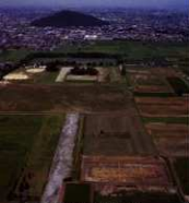
第6世紀上層からみた南門外宮内 (図中6)