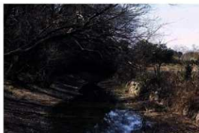
祭祀場【西別府祭祀遺跡】（湯殿神社裏の堀の様子）