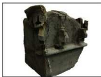
瓦塔の一部（塔の壁面）

今回の整理作業の中心は大量に出土した瓦（4,300 枚）、瓦塔（素焼で作ったミニチュアの仏塔）（90 点）を実測、トレースすることで、これらを下図のように図面化していきます。他にも幾つかの作業がありますが、こうした作業を経て、3 月には報告書として製本・刊行される予定です。（腰塚）