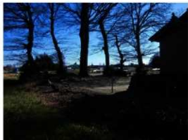
八坂神社境内に所在する古墳（中央、右が神社社殿）

3 基の古墳は、各々消滅、墳丘削平の状態で、唯一墳丘の状態が分かる古墳が、くまびあの南に鎮座する八坂神社の境内北東隅に所在します。現況での規模は、東西 8 m、南北 1 5. 5 m、高さ 1 m ほどで、墳丘の南西部が遺存しているものと思われます。全国的に見ると、墳丘上に社を祀ることが多い中、古くから神聖な場所であったこの場所を選んで、墳丘を避けて社が造られたのではないのでしょうか。ちなみに、八坂神社は、かつて鬱蒼とした林の中に在り、「天王社」と呼ばれていたことから現在も「天王様」の通称で親しまれていて、本古墳は現在無名ですが、この名を借りて天王塚古墳とも言えますでしょうか。（吉野）