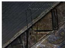
第 1 号方形周溝墓検出状況（真上から）