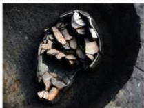
第 2 号方形周溝墓出土遺物検出状況

平成 28 年 1 月から 3 月にかけて新設道路予定地の発掘調査を実施しました。調査面積 1,400 m 2 の範囲において、弥生時代中期から古墳時代前期にわたる住居跡 6 軒、方形周溝墓 2 基、室町から江戸時代にかけての溝跡が複数確認されました。そのうち方形周溝墓はいずれも全体の 50% 以上の規模で、2 基とも 20 m 程度の大きさをもつ墓でした。残念ながら、被葬者が埋葬されていた主体部は確認されませんでした。周溝に転落した弥生土器片が多量に検出され、土器の特徴から時期判断できる重要な発見となりました。（腰塚）