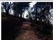
遊歩道の整備事業

熊谷市三ヶ尻に位置する観音山は標高約85m、周囲約850mで、松・なら・くぬぎ等が豊富に植生し、熊谷市の名勝に指定されています。南麓には龍泉寺が所在しています。江戸時代の知の巨人である渡辺崋山もこの地を訪れ、その風光明媚な風景を絵にしたためるなどしています。平成28年度においては熊谷市と地元の観音山保存会との市民協働事業が実施され、樹木の管理や遊歩道の整備を行いました。今後は文化財の保存に向けた補助事業を中心として、所有者及び地域の保存会である「観音山保存会」とともに名勝の保全を継続的に進めていく予定です。(山下)