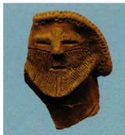
池上遺跡出土土偶形容器

このたび、発掘調査から約40年の時を経て、池上遺跡から出土した弥生時代の遺物が、「池上遺跡出土品」の名称で埼玉県の文化財(有形文化財・考古資料)に指定されました。「池上遺跡出土品」は、現在、埼玉県立さきたま史跡の博物館で開催中の「弥生の空間 爽りと祈り」(2/25~6/11)において展示されていますので、ぜひご覧ください。(松田)