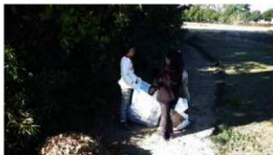
小学生による落ち葉拾い

11 月 30 日、国指定史跡「宮塚古墳」において地元の広西子ども会の児童（大森小学校）及び保護者、約 20 名による清掃が実施されました。宮塚古墳は上円下方墳と呼ばれる珍しい形をしていることから、昭和 31 年に国指定史跡に指定されました。参加者は落ち葉や枝などを協力して集めて袋に詰め込んでいました。清掃後、担当職員から古墳や市内の文化財についての説明を行いました。