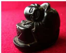
（写真：根付「茶磨坊主」）

遺跡からの出土例は、中世では寺院・城館跡・墓域から、近世では大名屋敷・城館跡から主に出土しています。今回の展示では、市内出土品の他、伝世品や陶製の茶磨、根付等も展示しました。（熊谷デジタルミュージアムの読書室〈PDF 文庫・パンフレット〉に資料を掲載）