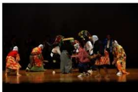
須賀広ササラ獅子舞

11 月 23 日、江南総合文化会館ビビア・ホールにて埼玉県芸術文化祭 2013 地域文化事業「第六回地域伝統芸能今昔物語」を開催しました。約 550 名の来場者が無形の文化財保持団体の 7 団体・芸能 7 団体、賛助出演 1 団体の、計 15 団体による共演を鑑賞されました。伝統芸能を次世代に継承することを目的に、各団体ともに児童生徒を始めとした多くの若手の出演がありました。同会場では無形民俗文化財パネル展も開催し、市内の伝統芸能や世界無形文化遺産の紹介を行いました。